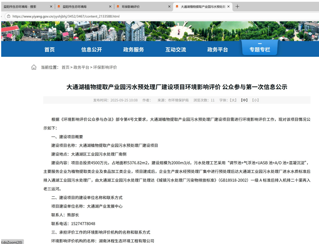
图 1 第一次网上公示截图

根据《环境影响评价公众参与办法 生态环境部令 第 4 号》第九条要求建设单位应当在确定环境影响报告书编制单位后 7 个工作日内，通过其网站、建设项目所在地公共媒体网站或者建设项目所在地相关政府网站（以下统称网络平台）公开相应信息。因此，大通湖产业发展中心在 2025 年 9 月 20 日委托湖南沐程生态环境工程有限公司后的 7 个工作日内，2025 年 9 月 25 日在益阳市生态环境局网站进行了此项目的第一次公示。公开网址为 https://www.yiyang.gov.cn/yyshjbhj/3452/3467/content_2133588.html ，公示截图见图 1 所示。公开载体的选取也符合《环境影响评价公众参与办法 生态环境部令 第 4 号》第九条的规定。