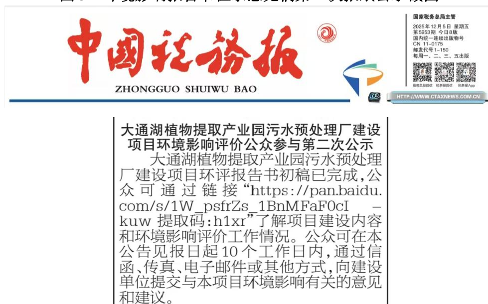
图4 环境影响报告书征求意见稿第二次报纸公示截图