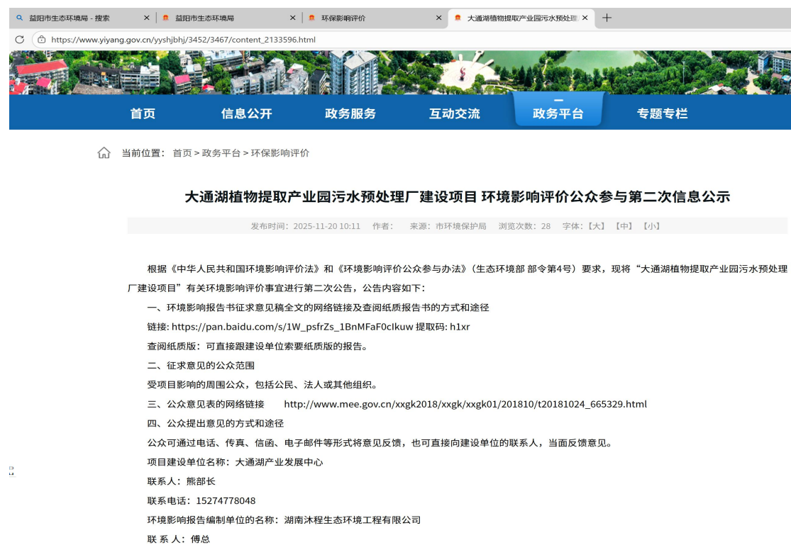
图 2 第二次网上公示截图

根据《环境影响评价公众参与办法 生态环境部令 第 4 号》第十条规定建设项目环境影响报告书征求意见稿形成后，应对征求意见稿及其它相关信息进行公示。第十一条规定公开的信息的方式之一是通过网络平台公开，且持续公开期限不得少于 10 个工作日。因此，建设单位在益阳市生态环境局网站上进行了第二次网上公示： https://www.yiyang.gov.cn/yyshjbhj/3452/3467/content_2133590.html ，公示截图见图 2 所示。因此，公开载体的选取是符合《环境影响评价公众参与办法 生态环境部令 第 4 号》第十一条的规定。