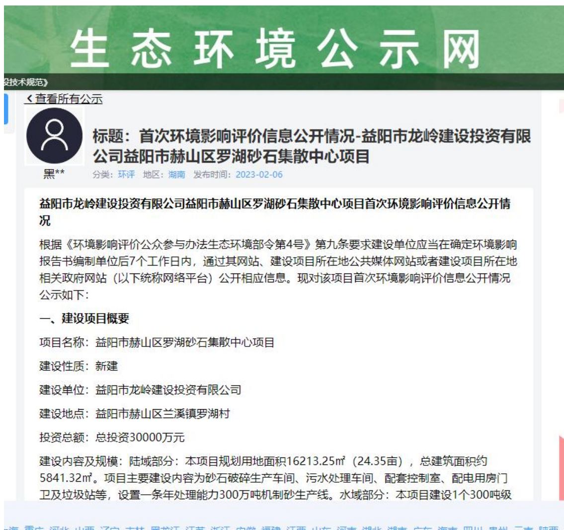
图 2-1 第一次网上公示