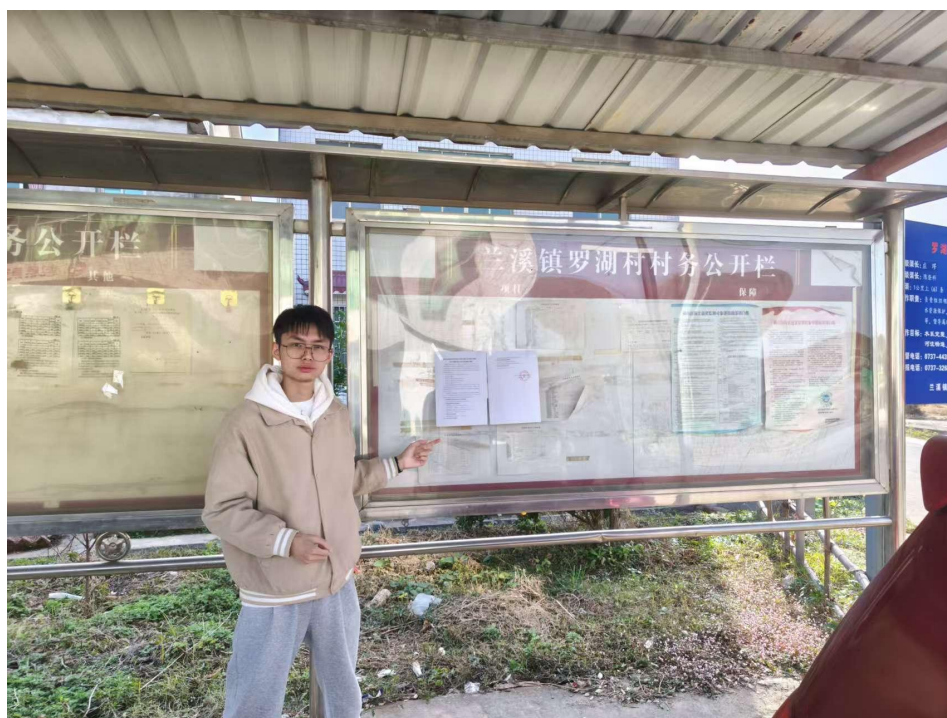
图 3-3 兰溪镇罗湖村公告栏现场张贴照片