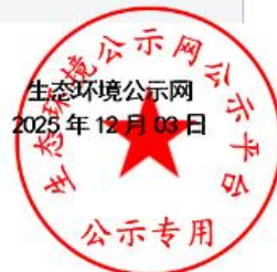
图 3-1 第二次环境影响评价信息公开网络公示截图