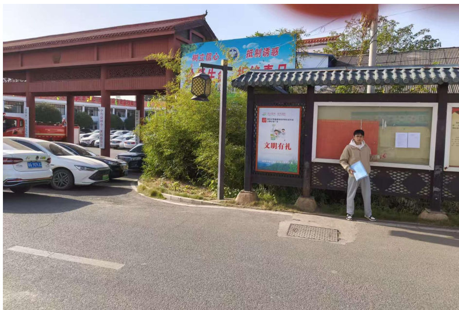
图 3-2 兰溪镇公告栏现场张贴照片

于 2025 年 11 月 26 日在园区公告栏上进行张贴公示，公示时间为 10 个工作日，粘贴位置为兰溪镇公告栏和兰溪镇罗湖村公告栏，符合要求。