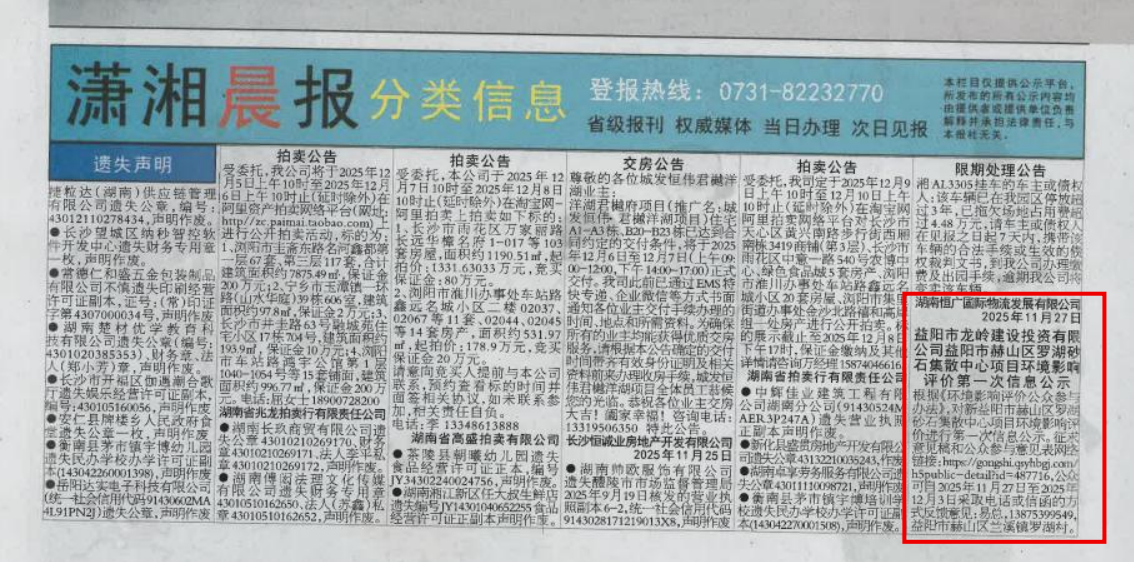
图 3-4 《潇湘晨报》第一次公示照片

项目在《潇湘晨报》上分别于2025年11月27日和11月28日进行两次公示，《潇湘晨报》是当地群众熟知的报纸，公示截图如下：