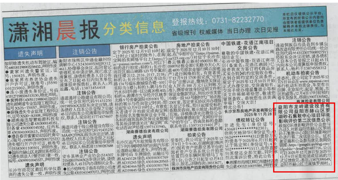
图 3-5 《潇湘晨报》第二次公示照片