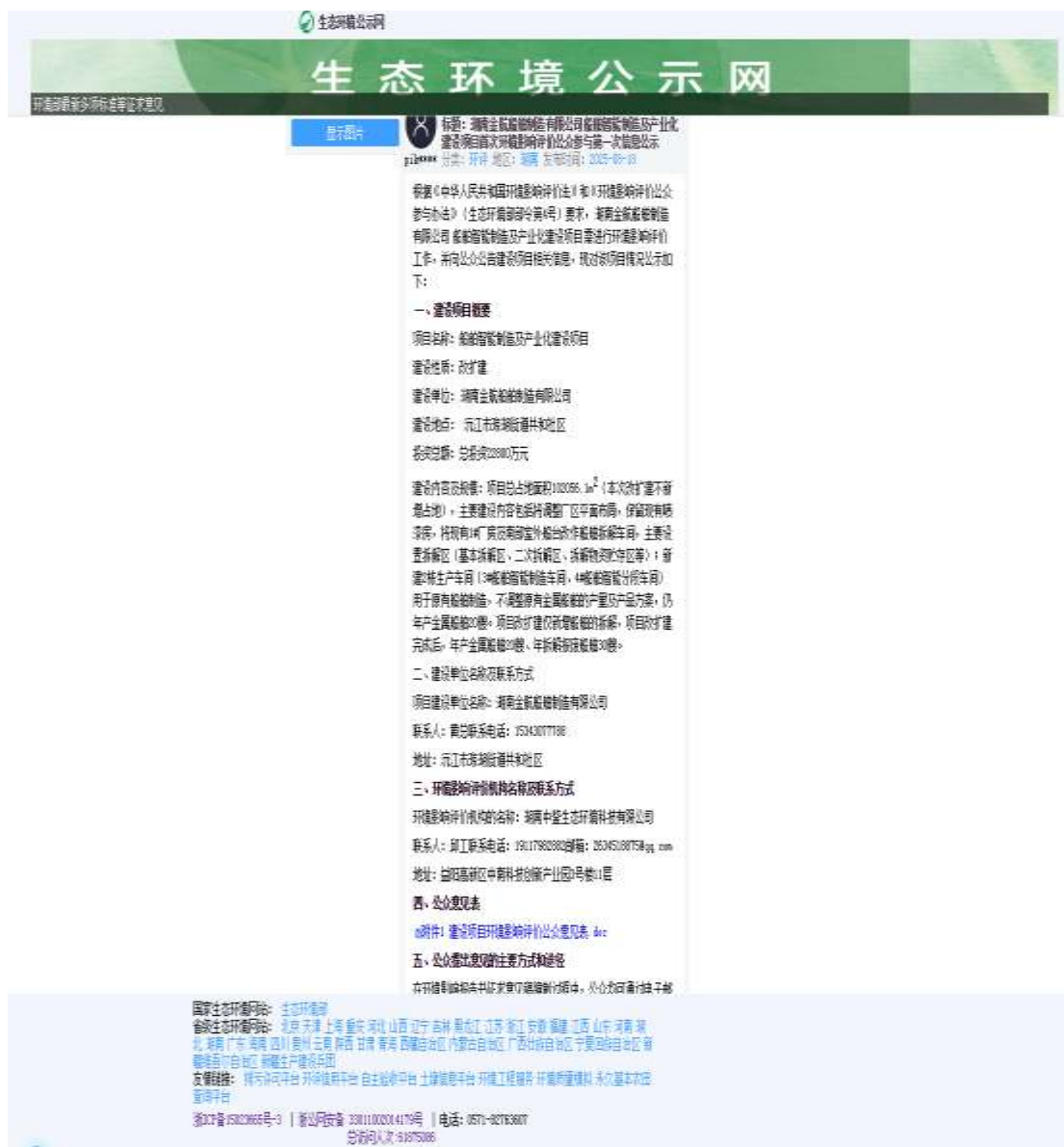
图 1 第一次网上公示截图