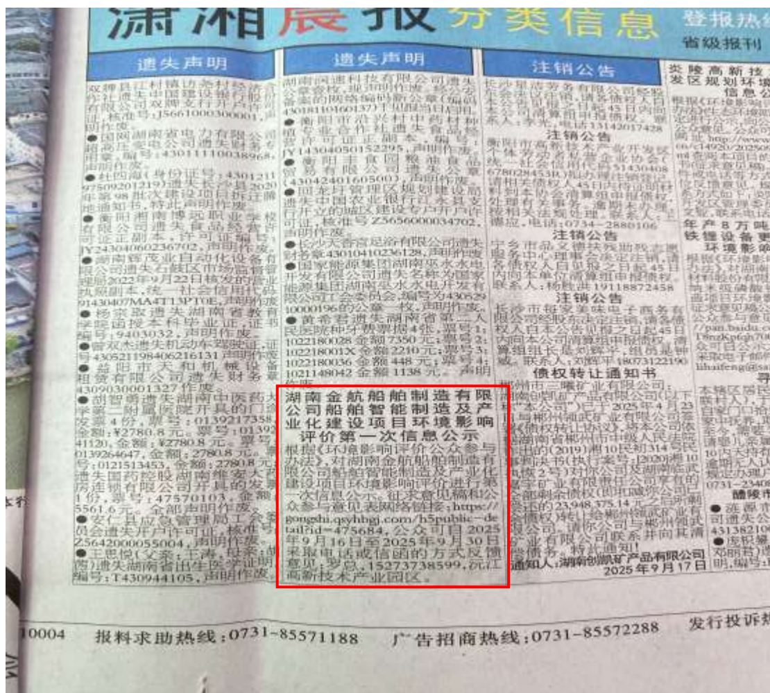
图3 环境影响报告书征求意见稿第一次报纸公示截图