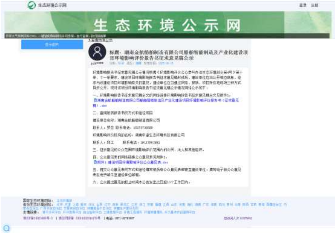
图 2 第二次网上公示截图

不得少于 10 个工作日。因此建设单位在生态环境公示网网站上进行了项目的第二次网上公示,公开网址为 https://gongshi.qsyhbgj.com/h5public-detail?id=475684 ,公示截图见图 2 所示。因此,公开载体的选取是符合《环境影响评价公众参与办法 生态环境部令 第 4 号》第十一条的规定。