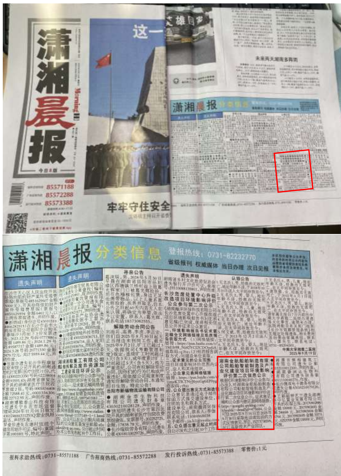
图 4 环境影响报告书征求意见稿第二次报纸公示截图