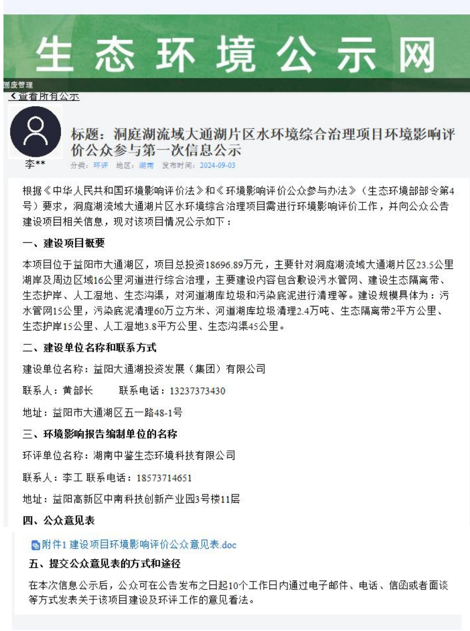
图 1 第一次网上公示截图

单位应当在确定环境影响报告书编制单位后 7 个工作日内，通过其网站、建设项目所在地公共媒体网站或者建设项目所在地相关政府网站（以下统称网络平台）公开相应信息。因此，益阳大通湖投资发展（集团）有限公司在 2024 年 9 月委托湖南中鉴生态环境科技有限公司后的 7 个工作日内，2024 年 9 月 3 日在环保小智网站进行了此项目的第一次公示。公开网址 https://gongshi.qsyhbgj.com/h5public-detail?id=413116 ，公示截图见图 1 所示。公开载体的选取也符合《环境影响评价公众参与办法 生态环境部令 第 4 号》第九条的规定。