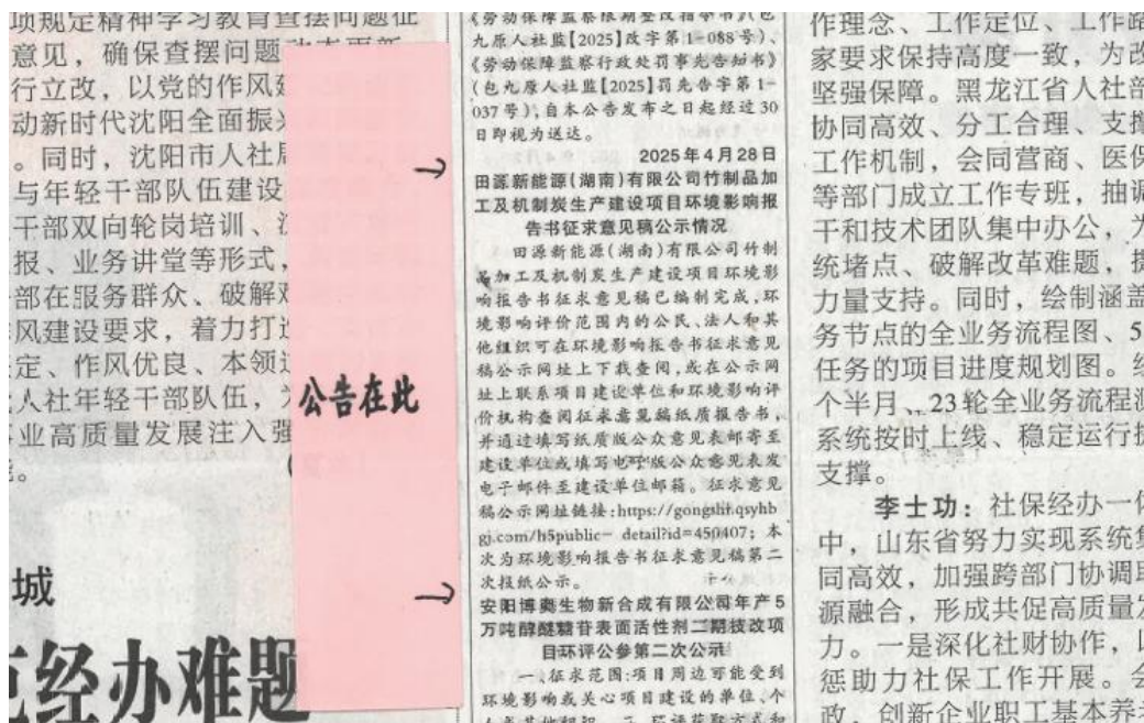
图4 环境影响报告书征求意见稿第二次报纸公示截图