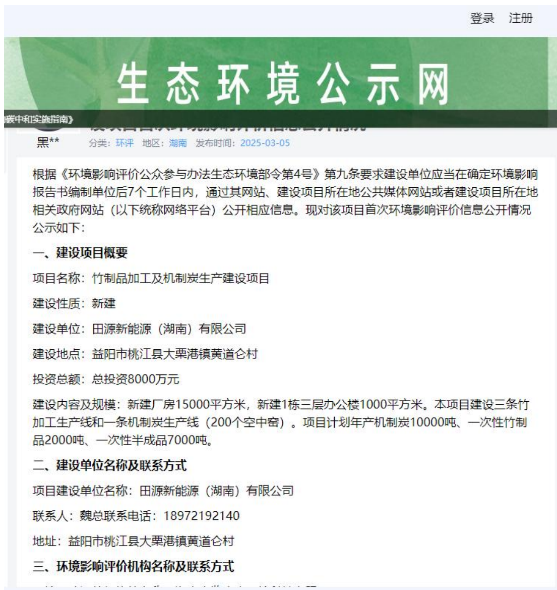
图 1 第一次网上公示截图