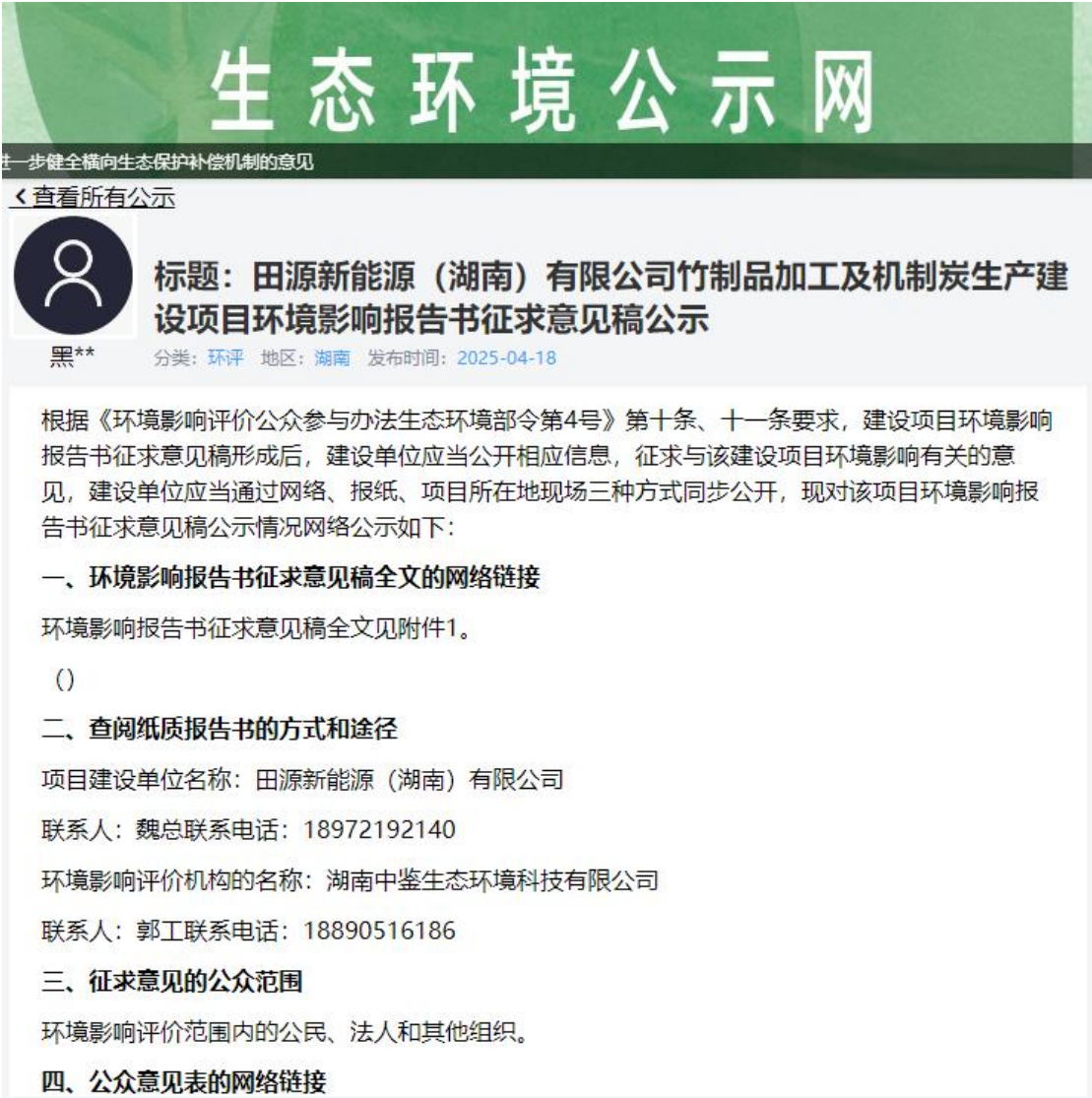
图 2 第二次网上公示截图

示。第十一条规定公开的信息的方式之一是通过网络平台公开，且持续公开期限不得少于 10 个工作日。因此建设单位在生态环境公示网上进行了此项目的第二次网上公示，公开网址为 https://gongshi.qsyhbgj.com/h5public-detail?id=450407 ，公示截图见图 2 所示。因此，公开载体的选取是符合《环境影响评价公众参与办法 生态环境部令 第 4 号》第十一条的规定。