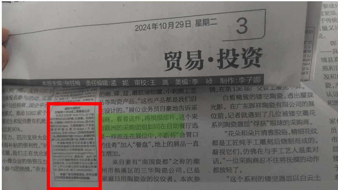
图 3.1-3 第二次公示之报纸公示 2