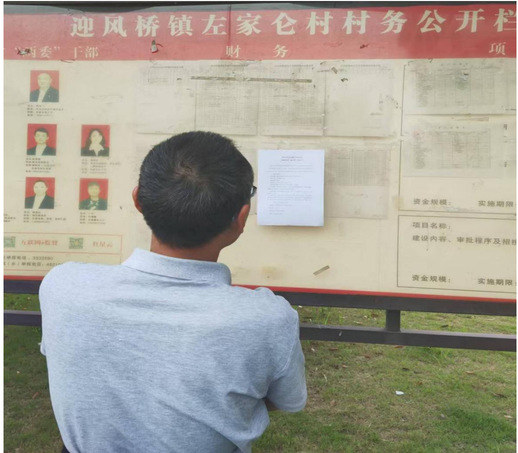
图 3.1-4 第二次公示之现场告示