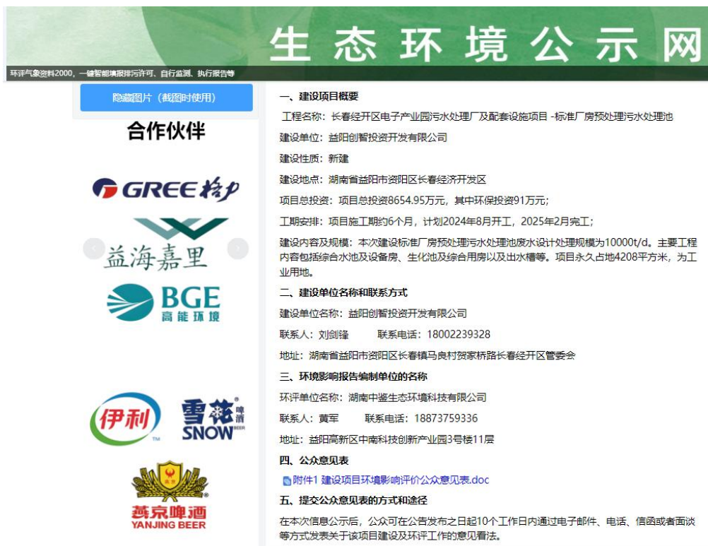
图1 第一次网上公示截图

根据《环境影响评价公众参与办法 生态环境部令 第4号》第九条要求建设单位应当在确定环境影响报告书编制单位后7个工作日内，通过其网站、建设项目所在地公共媒体网站或者建设项目所在地相关政府网站（以下统称网络平台）公开相应信息。因此，沅江市经昌工贸有限公司在2024年9月委托湖南中鉴生态环境科技有限公司后的7个工作日内，2024年9月10日在环保小智网站进行了此项目的第一次公示。公开网址 https://gongshi.qsyhbgj.com/h5public-detail?id=414313 ，公示截图见图1所示。公开载体的选取也符合《环境影响评价公众参与办法 生态环境部令 第4号》第九条的规定。