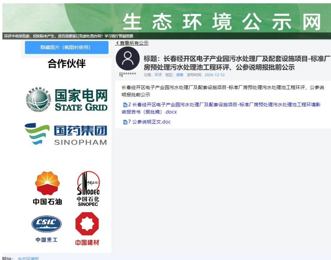
图 5 项目报批前公示截图