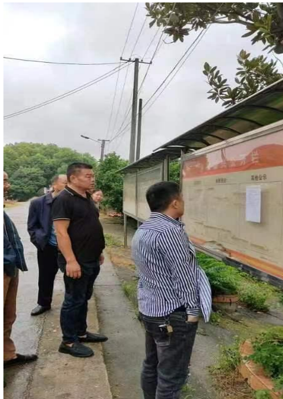
图 3.2-4 项目信息公告照片

建设单位于 2023 年 9 月 13 日在项目所在地的益阳市资阳区张家塞乡大谭州村村 务公开栏对项目情况进行了现场公示。公示照片见图 3.2-4。