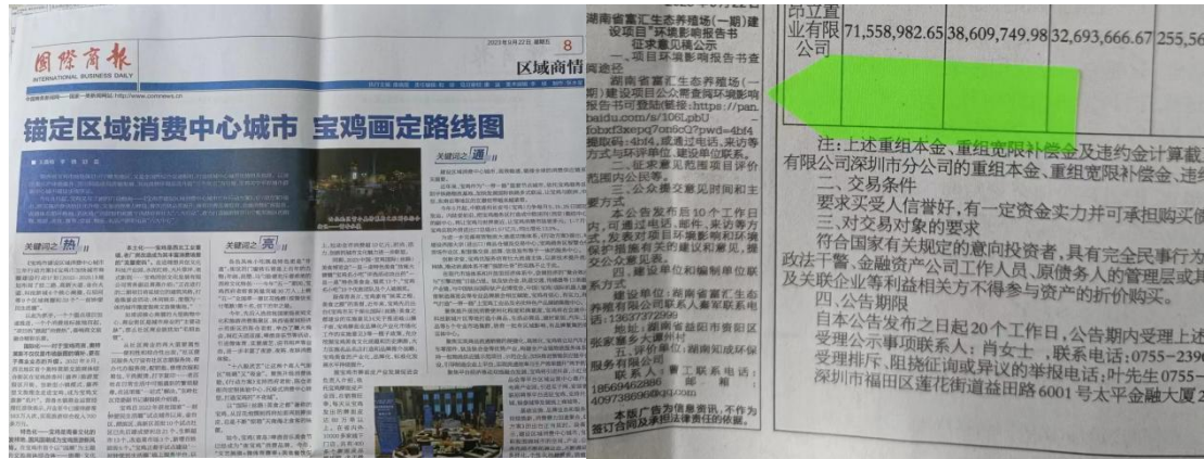
图 3.2-3 报纸公示 2（国际商报上 2023.9.22）