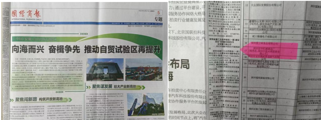
图 3.2-2 报纸公示 1（国际商报上 2023.9.21）

2023 年 9 月 21 日和 2023 年 9 月 22 日湖南省富汇生态养殖有限公司国际商报上进行了两次报纸公示。两次报纸公示见图 3.2-2 和图 3.2-3。