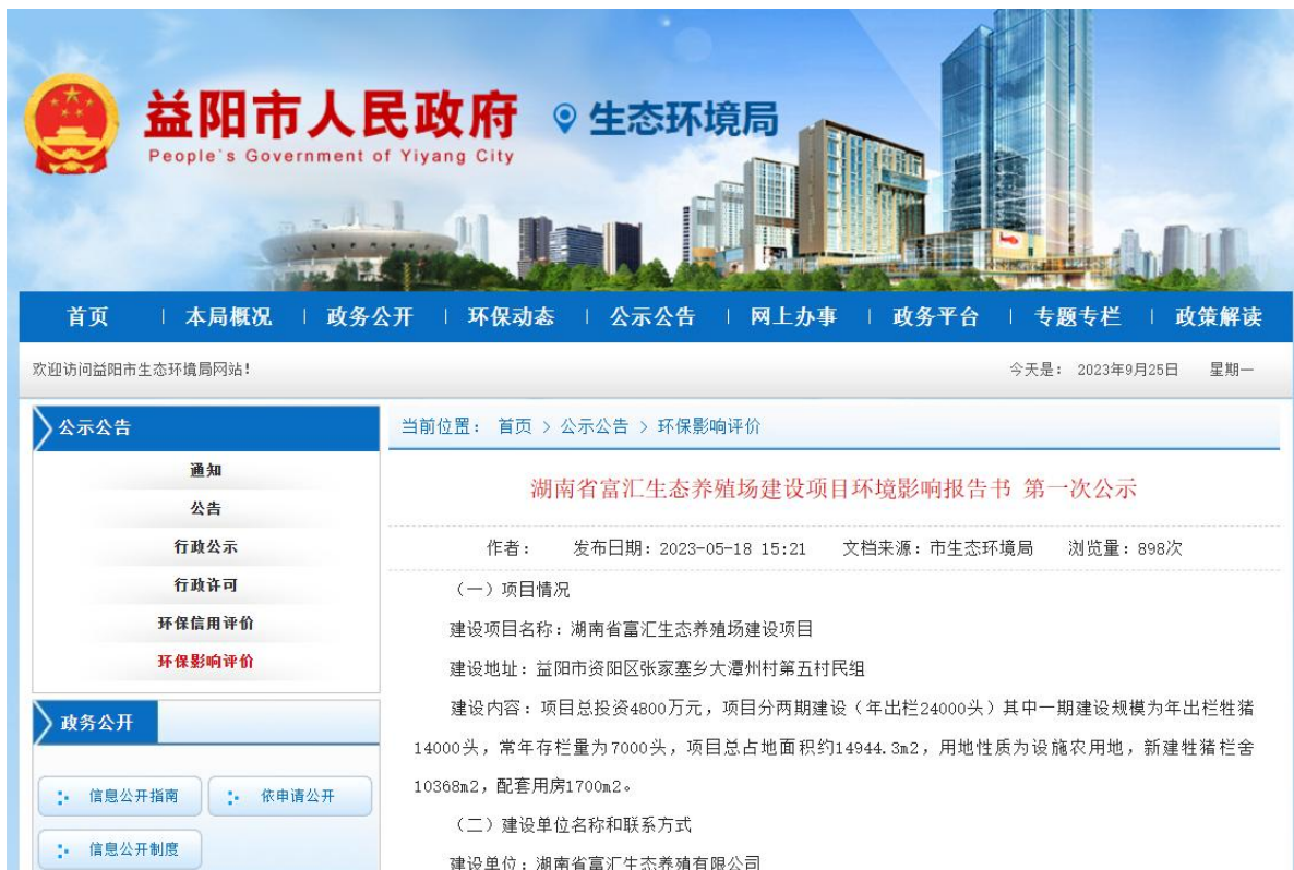
图 2.2-1 项目第一次网上公示截图

2023年5月12日，湖南省富汇生态养殖有限公司在益阳市生态环境局网站上进行了项目环评信息第一次网上公示（ http://www.yiyang.gov.cn/yyshjbhj/3452/3467/content_1766114.html ）。第一次网上公示见图 2.2-1。