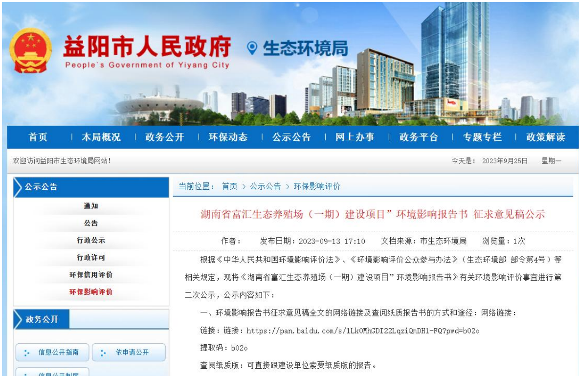
图 3.2-1 第二次网上公示截图