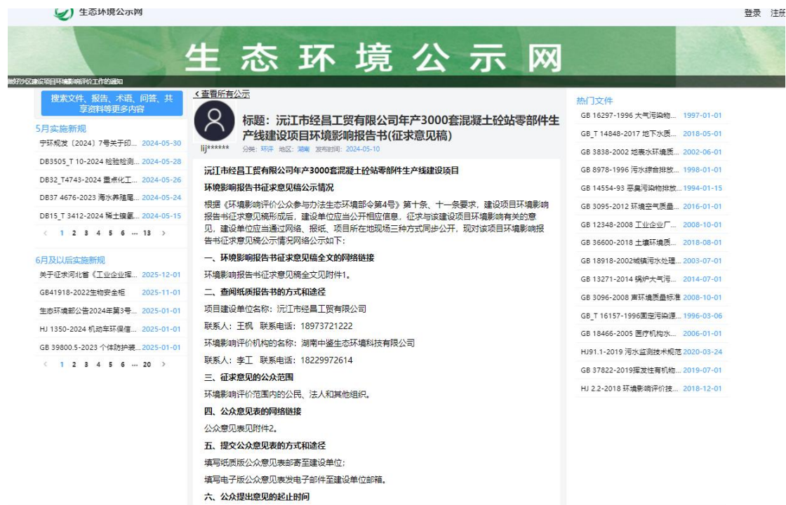
图 2 第二次网上公示截图

第十一条规定公开的信息的方式之一是通过网络平台公开，且持续公开期限不得少于 10 个工作日。因此建设单位在环保小智网站上进行了此项目的第二次网上公示，公开网址为 https://gongshi.qsyhbhj.com/h5public-detail?id=390456 ，公示截图见图 2 所示。因此，公开载体的选取是符合《环境影响评价公众参与办法 生态环境部令 第 4 号》第十一条的规定。