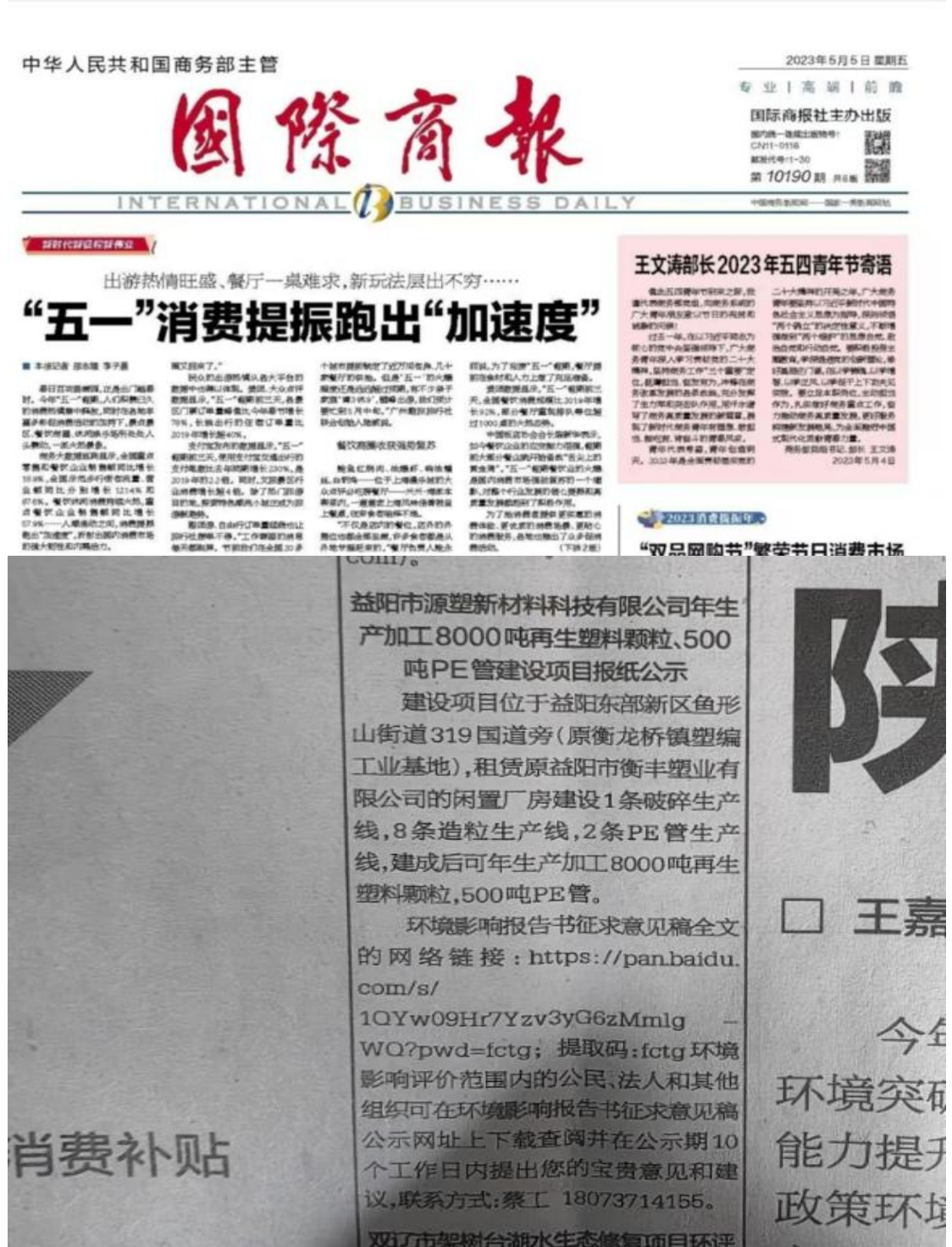
图 3.2-3 国际商报第一次公示照片

项目在《国际商报》上分别于 2023 年 5 月 5 日和 5 月 8 日进行两次公示，国际商报是当地群众熟知的报纸，公示截图如下：