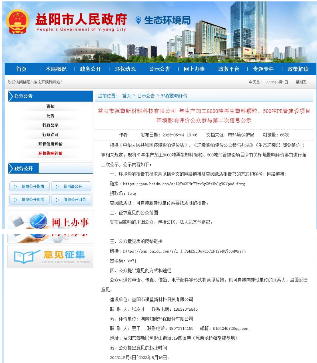
图 3.2-1 第二次环境影响评价信息公开网络公示截图