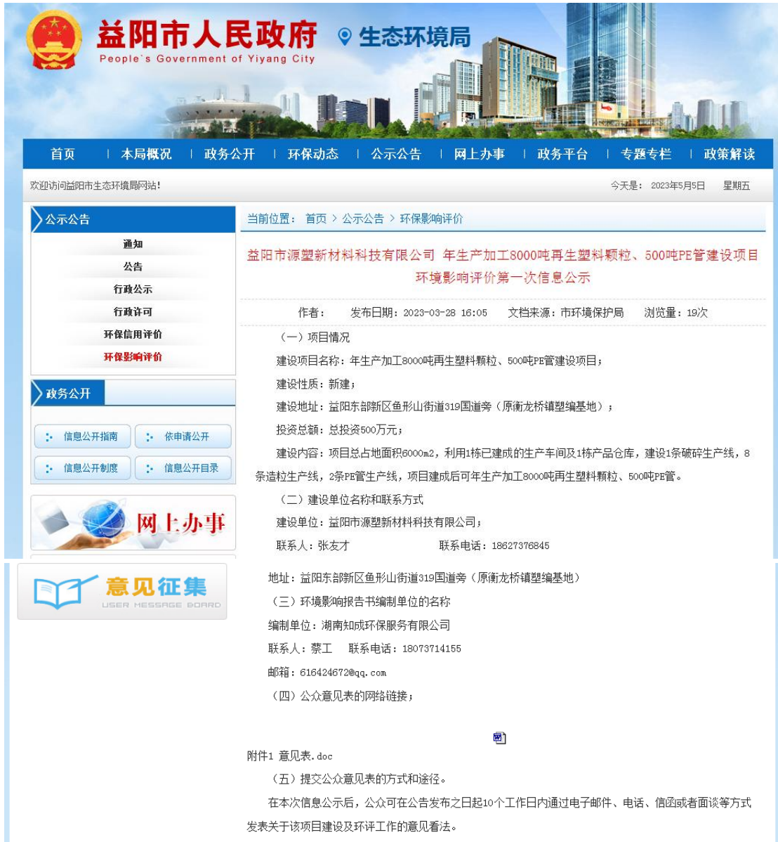
图 2-1 第一次环境影响评价信息公开网络公示截图