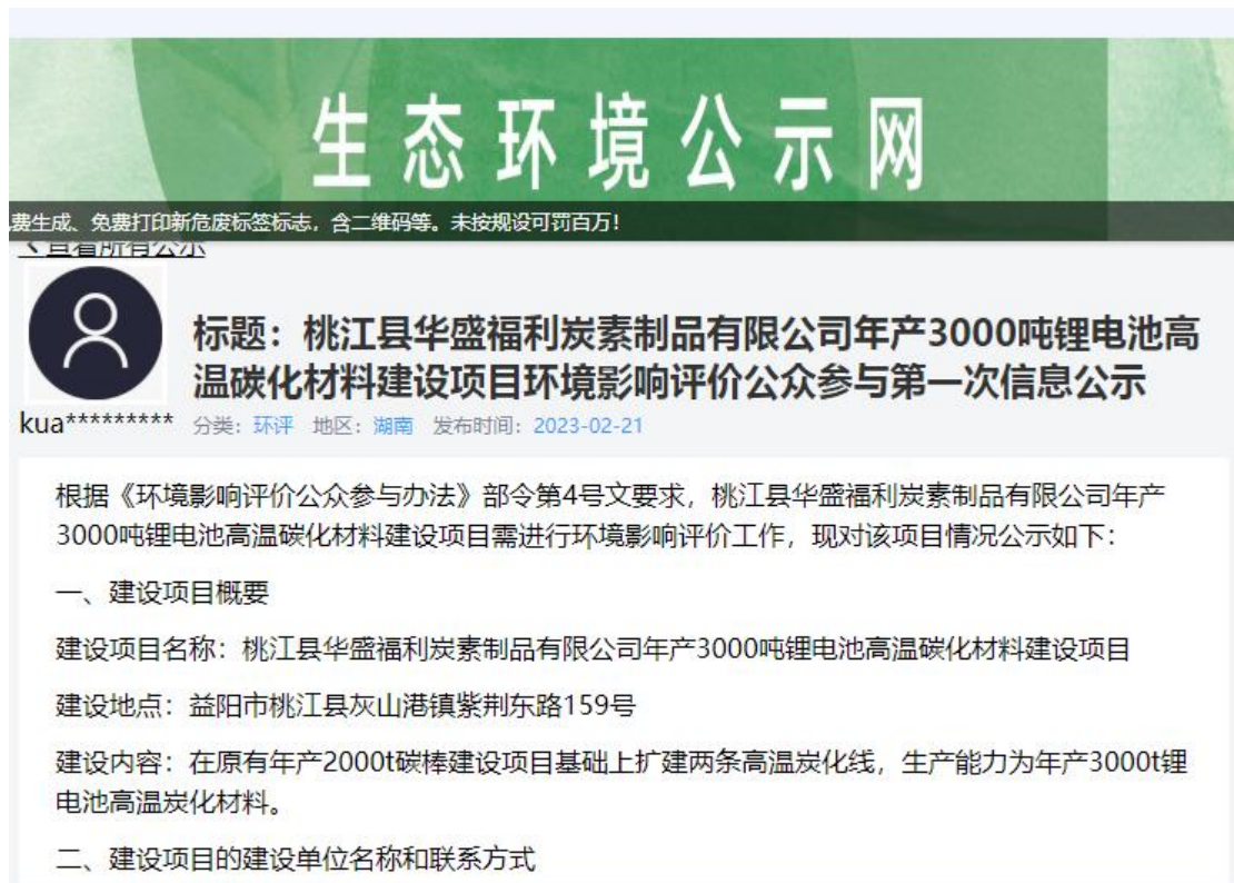
图 1 第一次网上公示截图