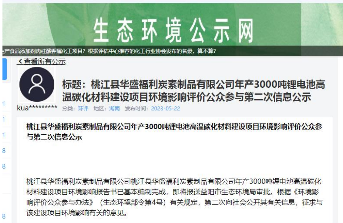
图 2 第二次网上公示截图