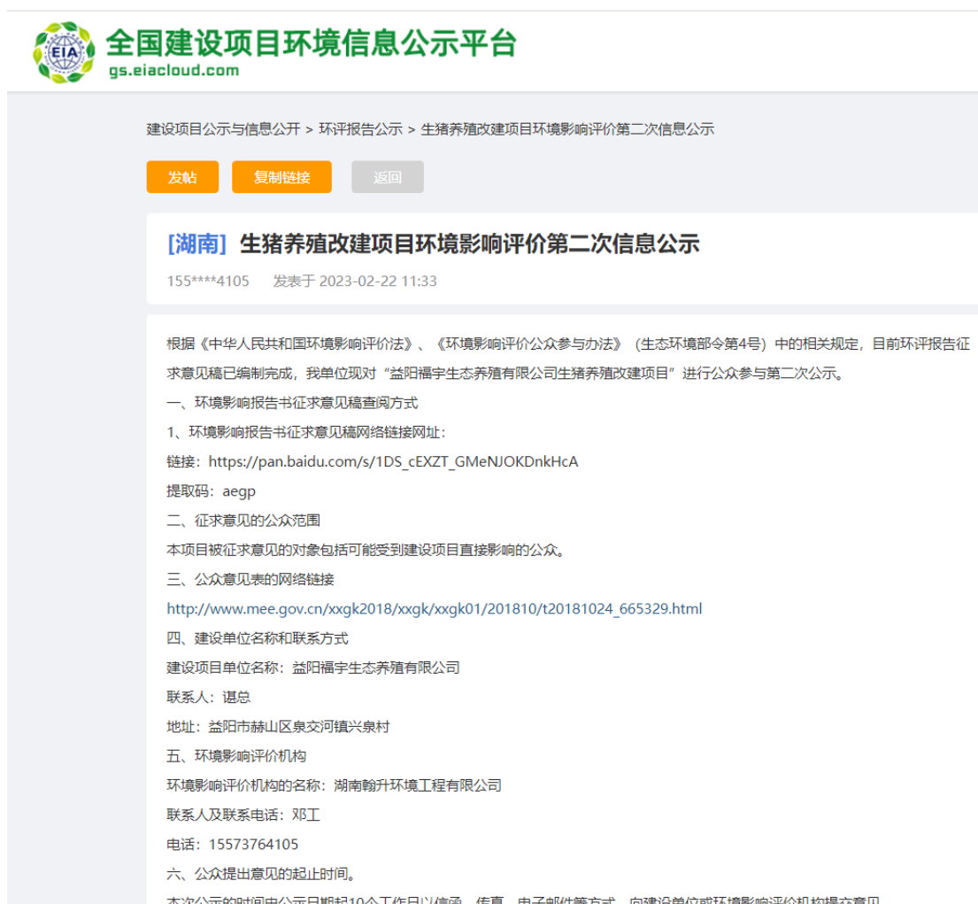
图 3-1 第二次公示网络公示截图