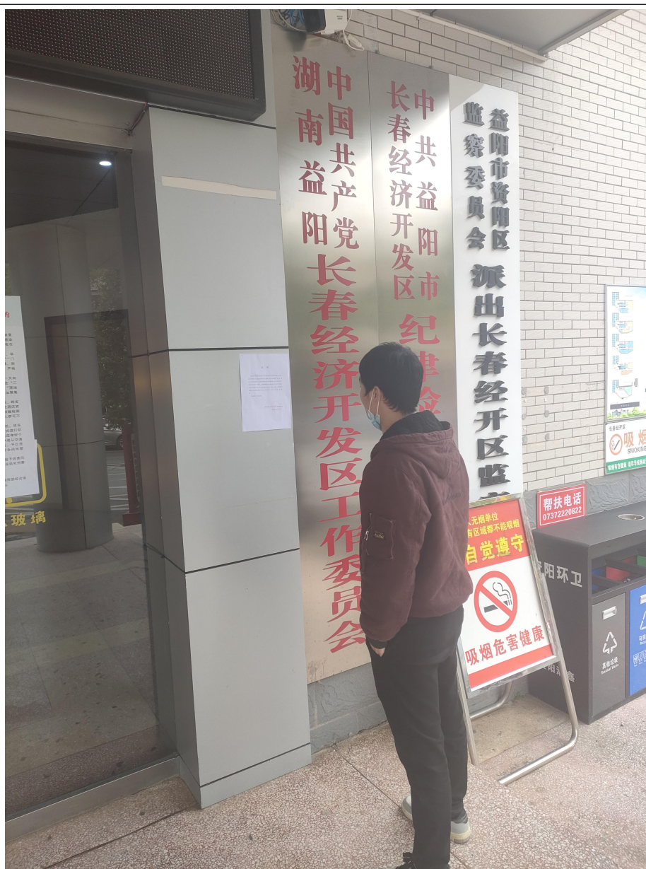
图 3-4 现场张贴公示照片

本项目于 2022 年 12 月 06 日，在湖南益阳长春经开区管委会宣传栏，对《年生产 300 万件金属制品建设项目环境影响评价公示》进行了张贴公示，公示情况见图 3-4。