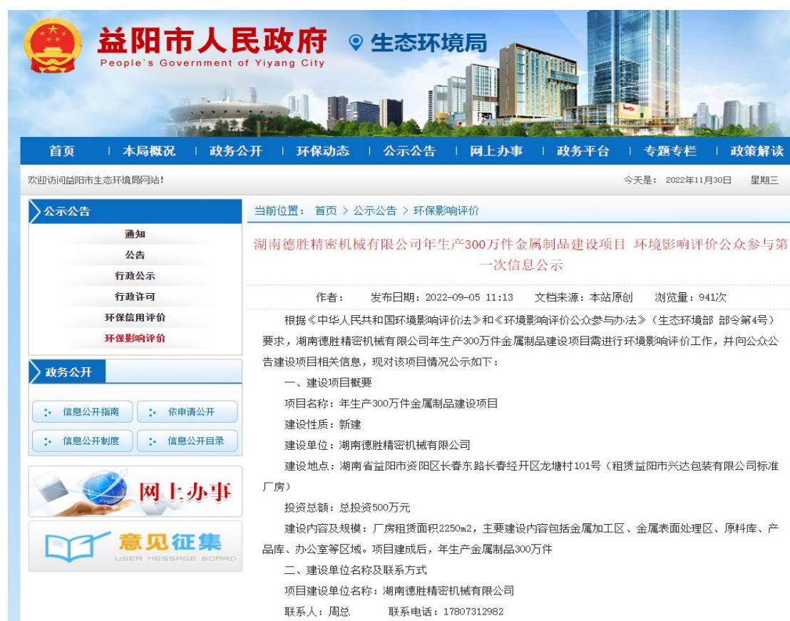
图 2-1 第一次环境影响评价信息网络公开截图

本项目于 2022 年 9 月 5 日在环境影响评价信息公示平台（ http://www.yiyang.gov.cn/yyshjbhj/3452/3467/content_1645006.html ）对《年生产 300 万件金属制品建设项目环境影响评价公众参与第一次信息公示》进行了公开，公开内容见图 2-1。