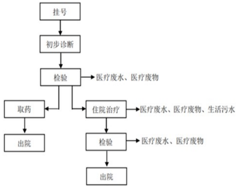
图 2-2 项目营运期工艺流程及产污节点图