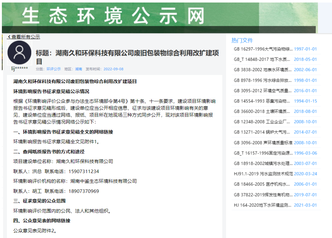
图 2 第二次网上公示截图

根据《环境影响评价公众参与办法 生态环境部令 第 4 号》第十条规定建设项目环境影响报告书征求意见稿形成后,应对征求意见稿及其它相关信息进行公示。第十一条规定公开的信息的方式之一是通过网络平台公开,且持续公开期限不得少于 10 个工作日。因此建设单位在生态环境公示网进行了此项目的第二次网上公示,公示截图见图 2 所示。因此,公开载体的选取是符合《环境影响评价公众参与办法 生态环境部令 第 4 号》第十一条的规定。