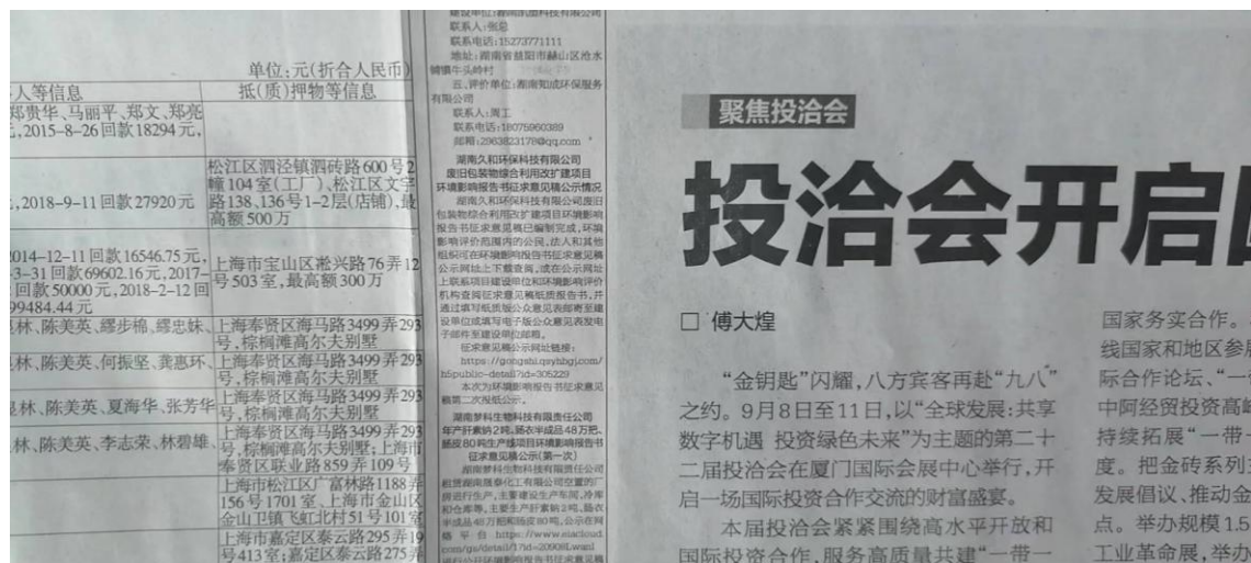
图 4 环境影响报告书征求意见稿第二次报纸公示截图