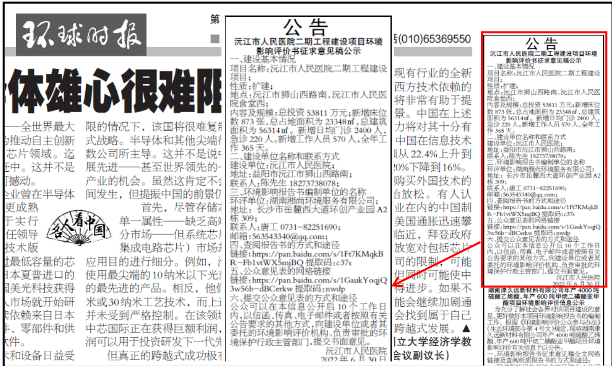
图3.2-2 征求意见稿报纸公示（环球时报2022年6月30日）