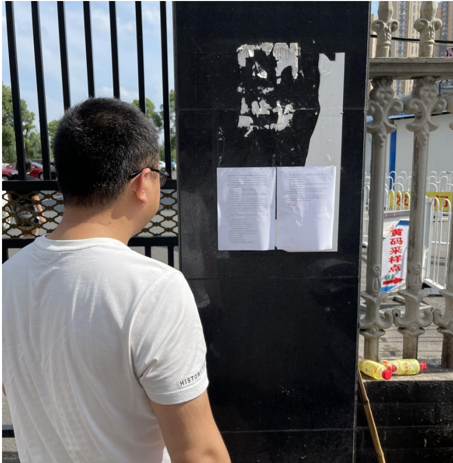
图3.2-5 项目公告张贴情况