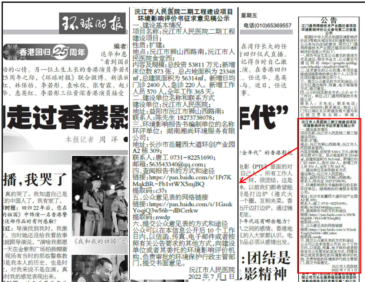
图3.2-3 征求意见稿报纸公示（环球时报2022年7月1日）