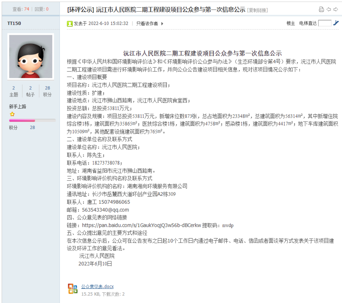
图2.2-1 首次信息公示截图（环保之家论坛）