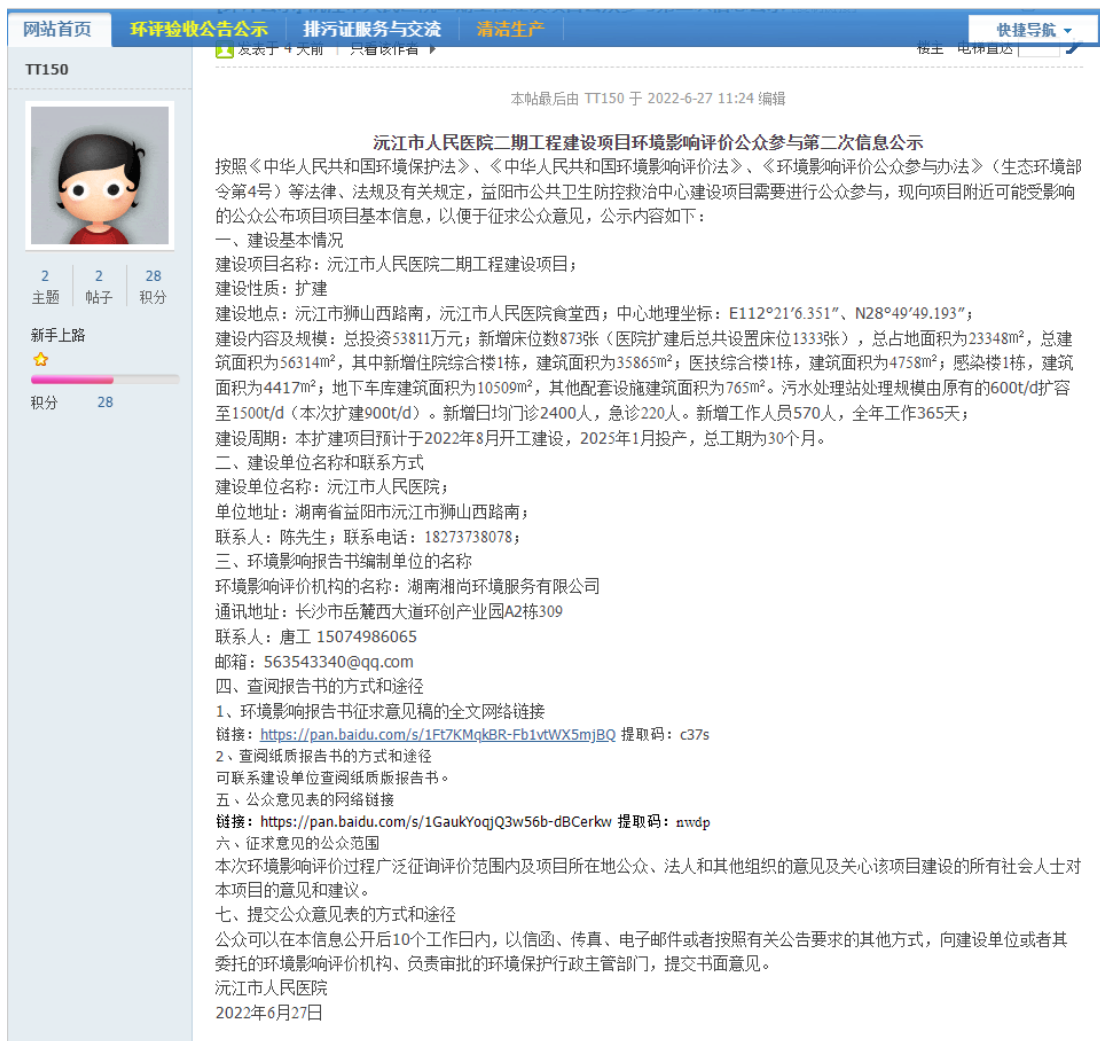
图3.2-1 征求意见稿公示截图（环保之家论坛）