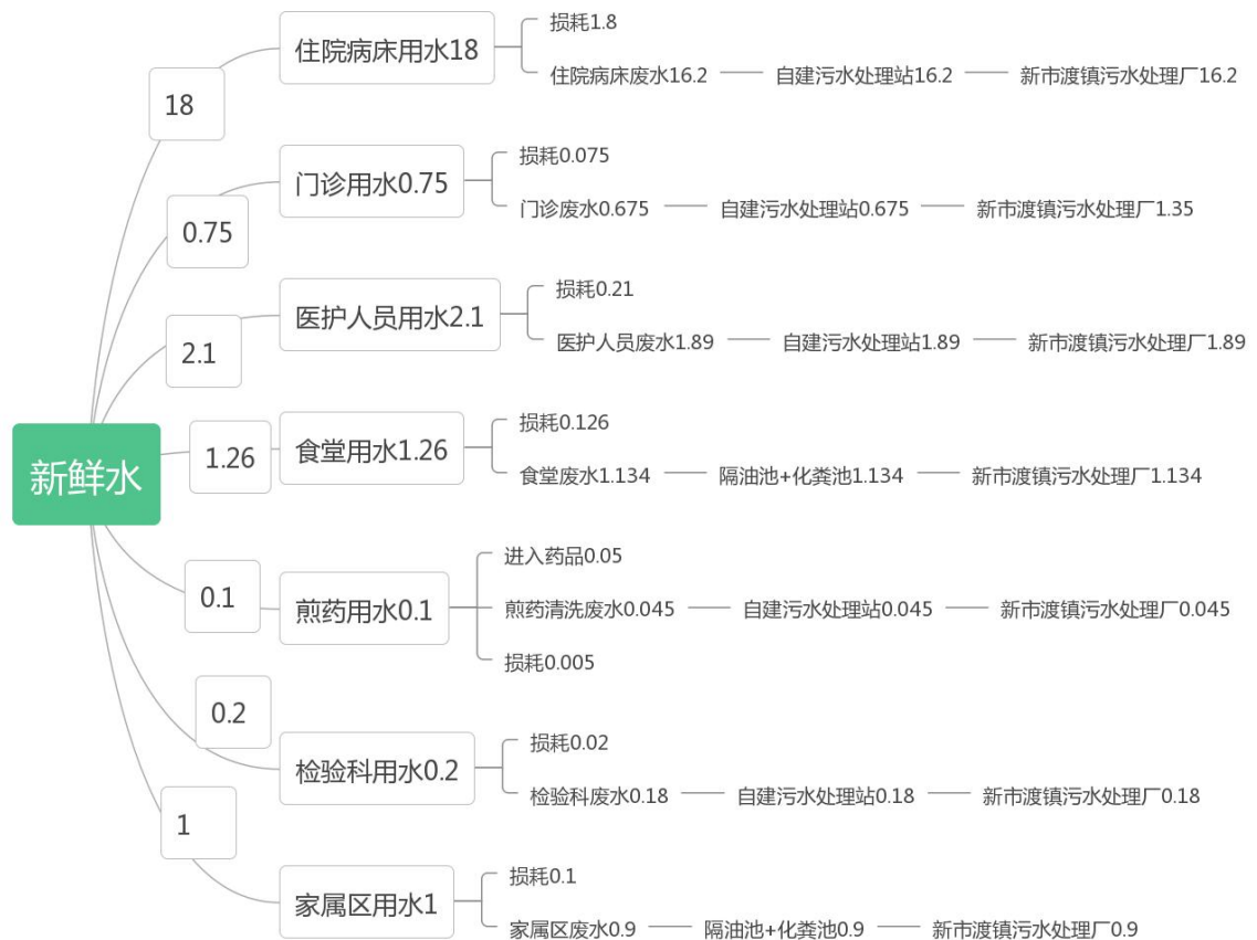
图 2-1 项目水平衡图 (m³/d)