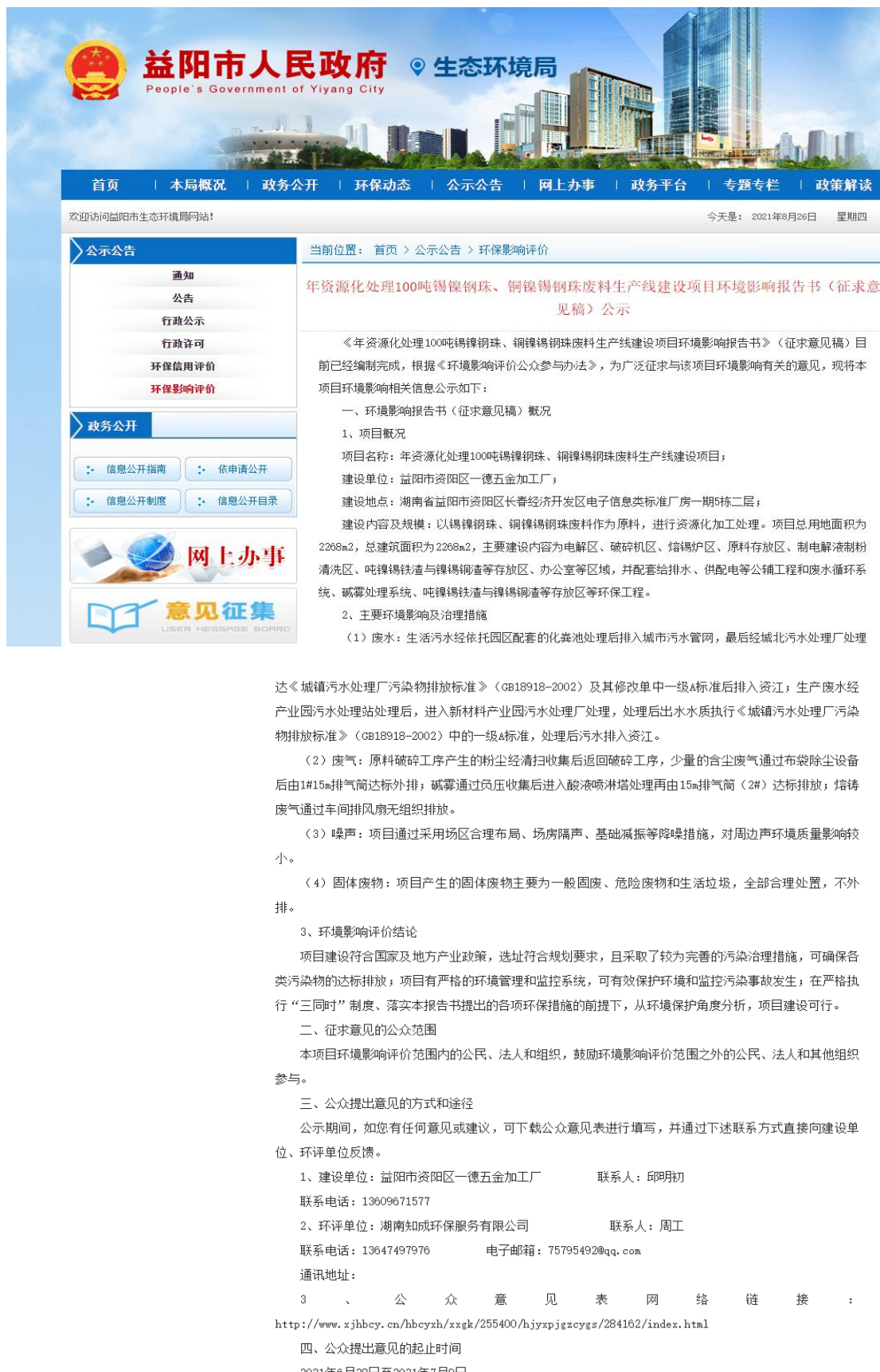
图 3.2-1 项目第二次网上公示截图