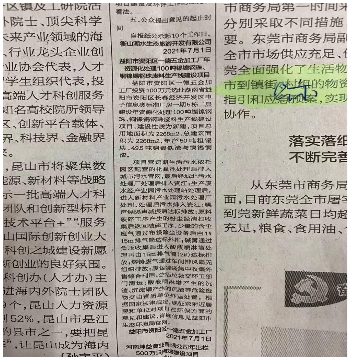
图 3.2-2 报纸公示 1 (国际商报上 2021.7.1)