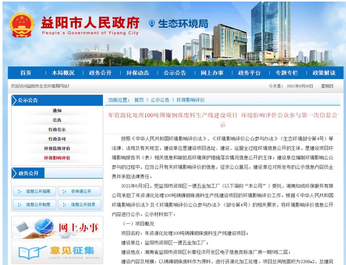
图 2.2-1 项目第一次网上公示截图