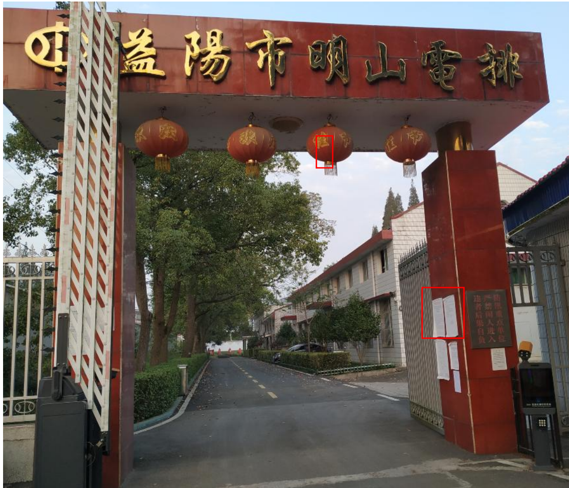
图 3.2-2 南县明山电排管理站大门口现场公示照片

我单位于 2021 年 10 月 27 日~11 月 9 日，以张贴公告的形式在项目所在地进行公示。具体张贴公示地点为：南县明山电排管理站大门口和附近的新村社区，现场公示照片见图 3.2-2、3.2-3。