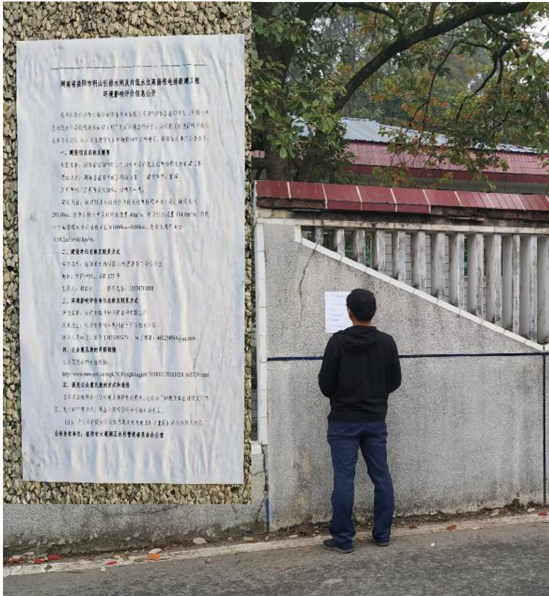
图 3.2-3 南县新村社区现场公示照片