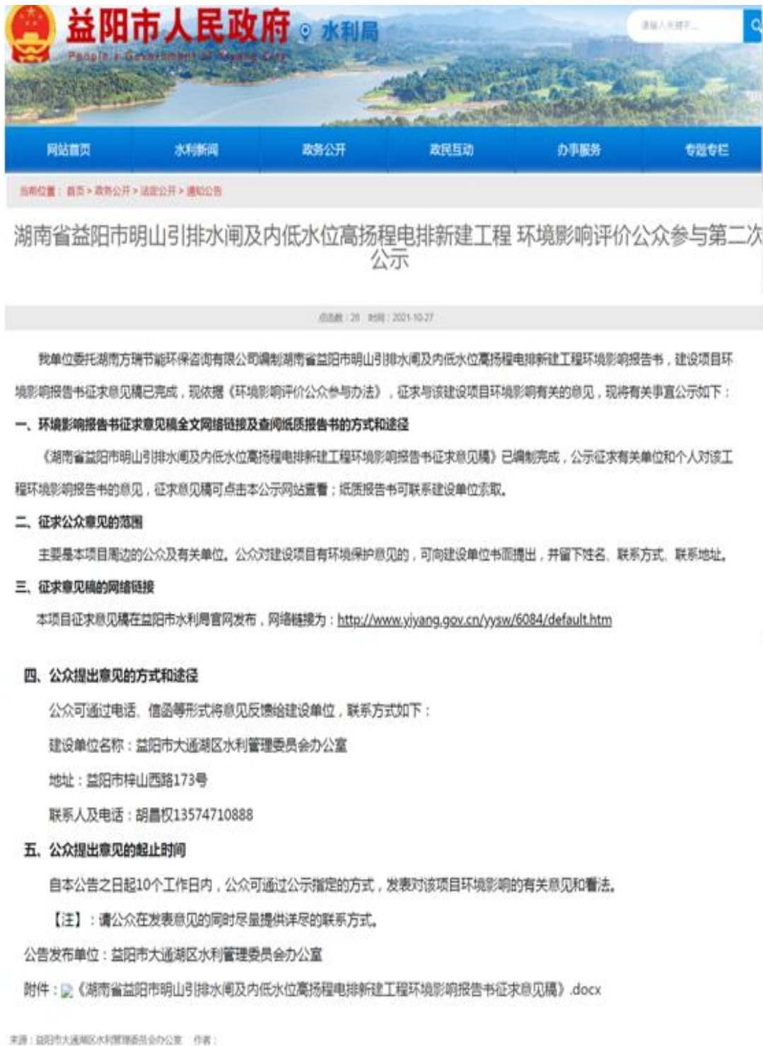
图 3.2-1 第二次网络公示截图