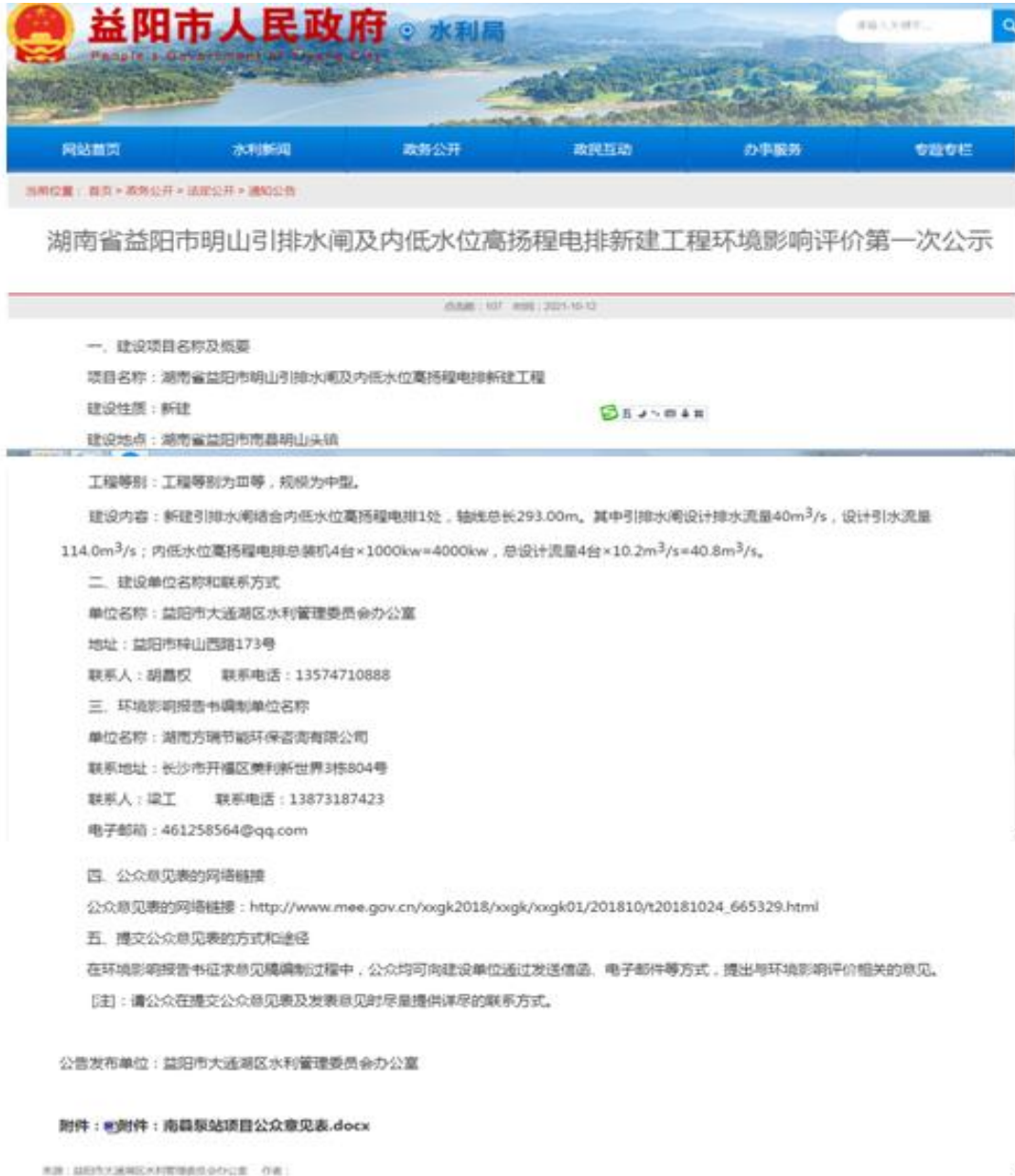
图 2.2-1 第一次公示截图