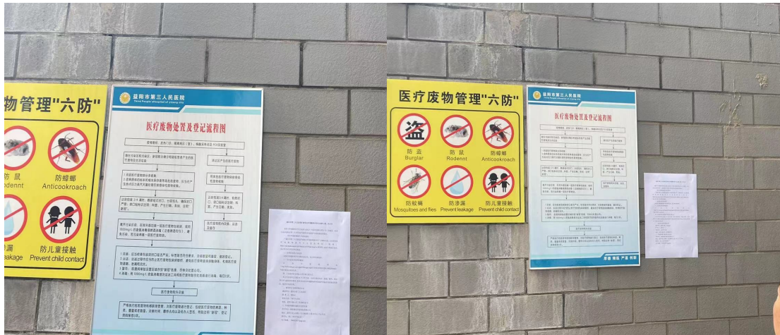
图 3-4 现场张贴公告

我院于 2021 年 11 月 19 日在医院所在地张贴了本项目环境影响评价第二次公示的公告。具体情况见图 3-4。