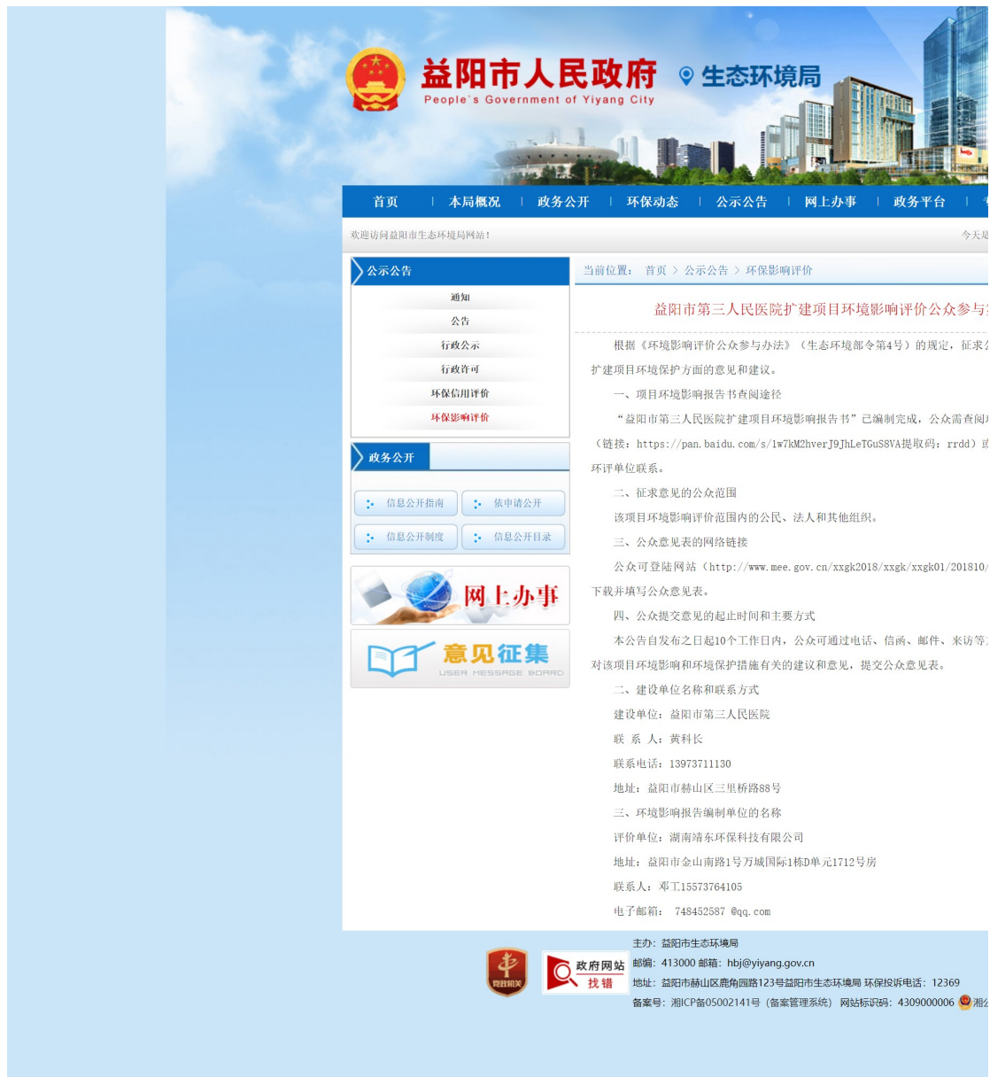
图 3-1 第二次公示网络公示截图