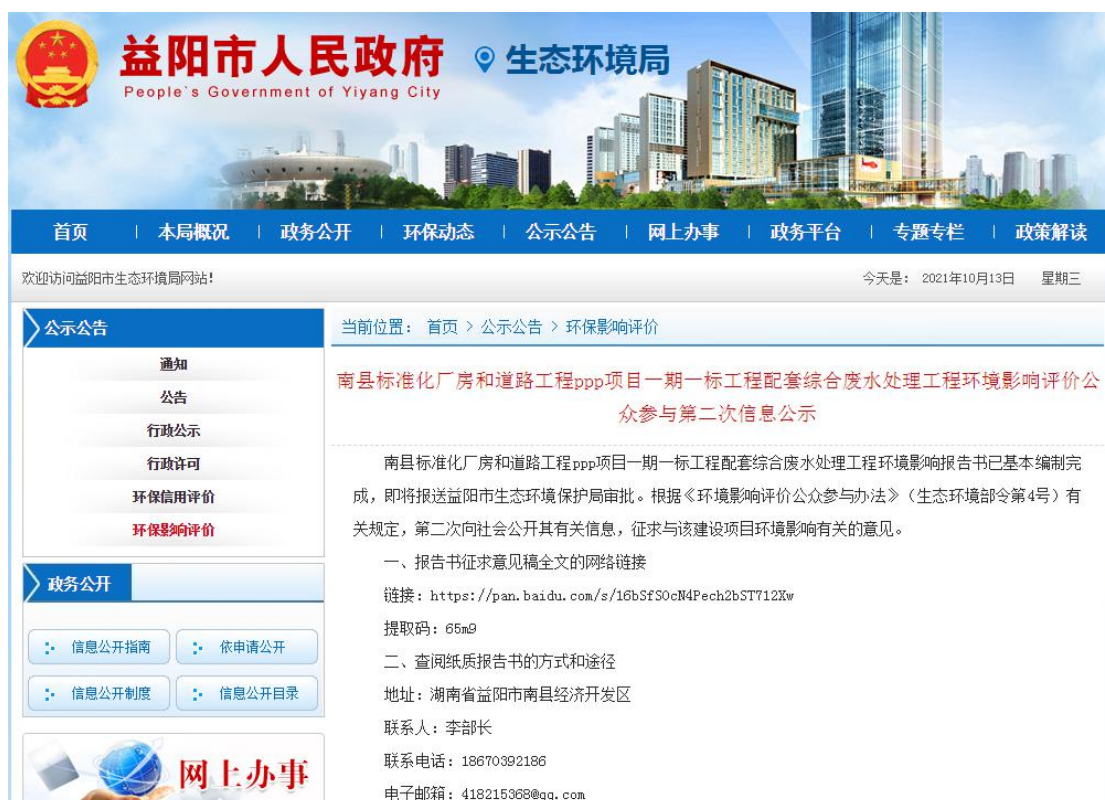
图 2 第二次网上公示截图

建设单位于 2021 年 9 月 6 日在益阳市环境保护局门户网站 ( http://www.yiyang.gov.cn/yyshjbhj/3452/3467/content_1460875.html ) 对本项目的环境保护情况进行了该项目的第二次网上公示。公示内容包括建设项目的简要工程概况, 公众查询环评报告书简本、索取补充信息的方式以及期限, 征求公众意见的范围和主要事项, 建设单位和环评单位的联系方式以及项目简本。公示期为 2021 年 9 月 6 日~2021 年 9 月 18 日, 公示情况见图 2。