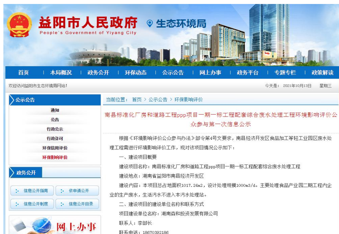
图1 第一次网上公示截图