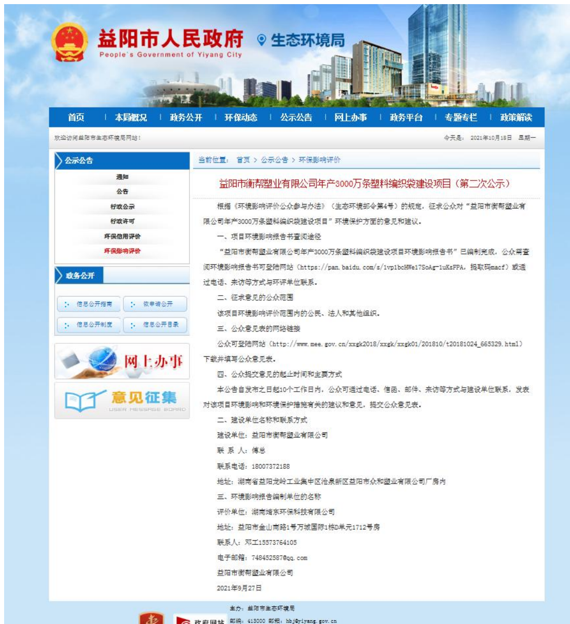
图 3-1 第二次公示网络公示截图