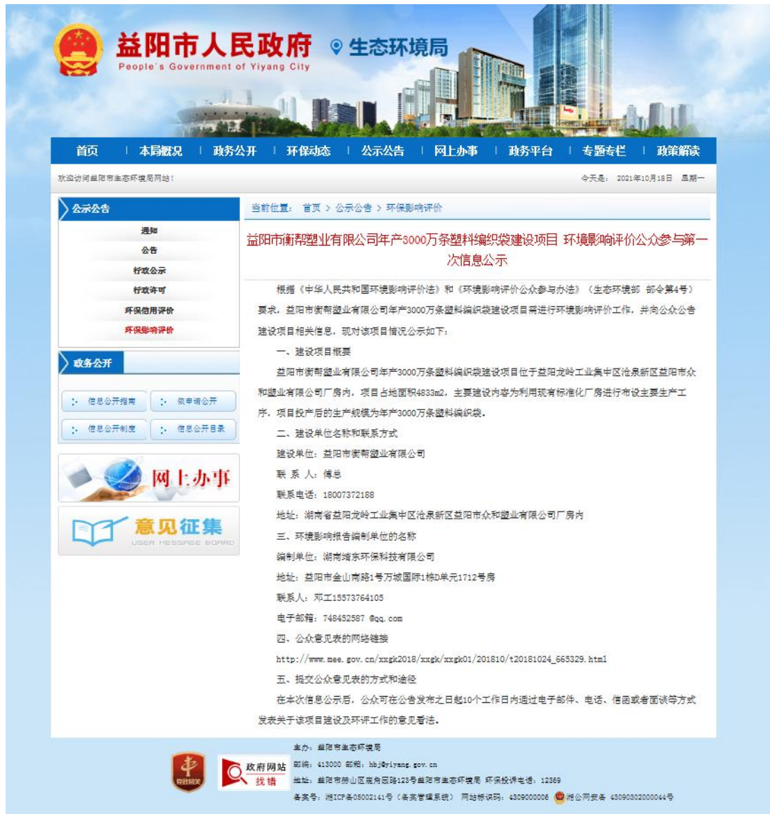
图 2-1 第一次公示网络截图