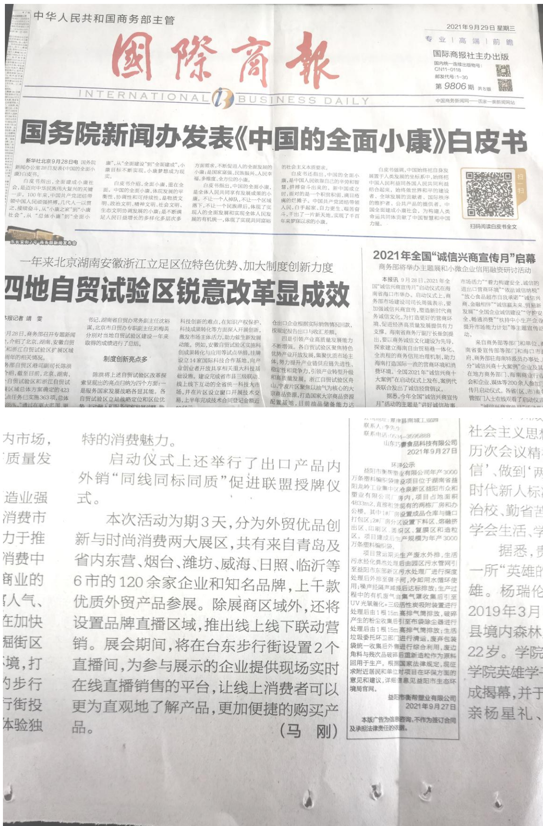
图 3-2 2021 年 9 月 29 日报纸公示