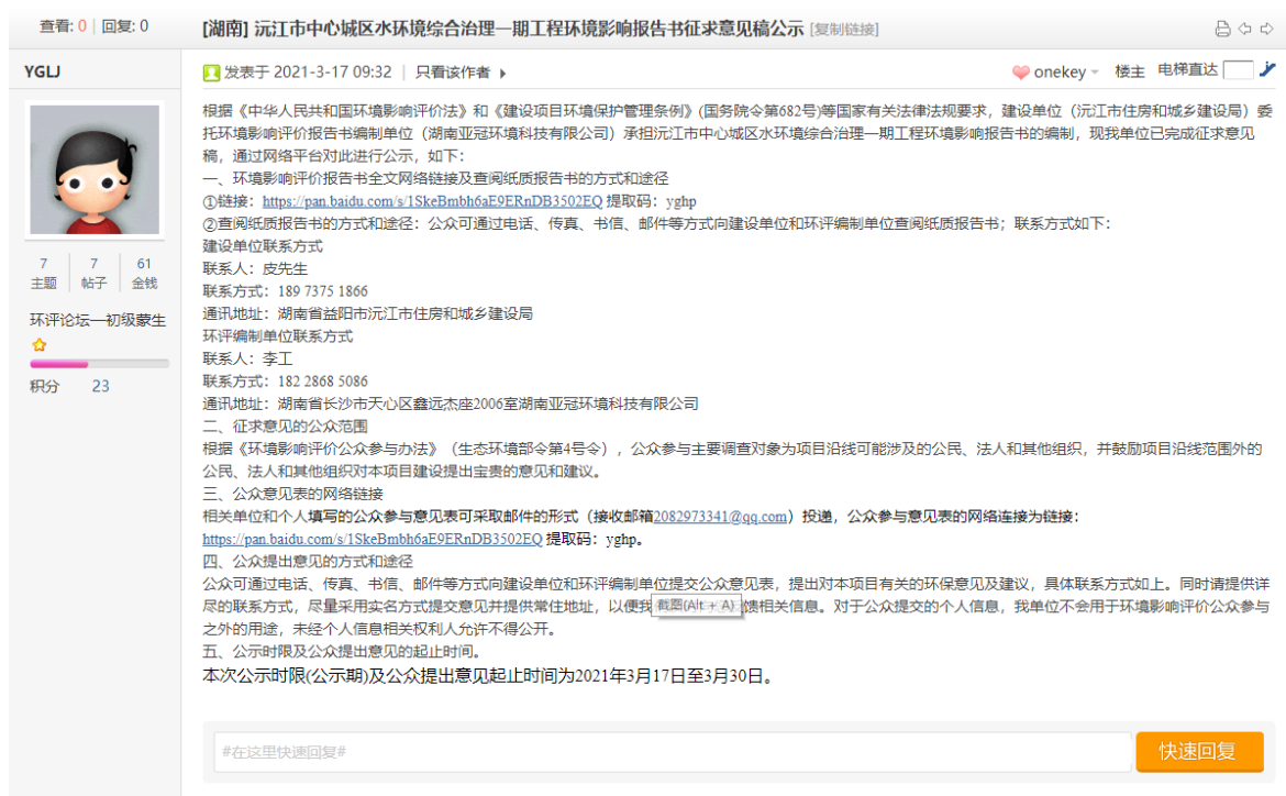
图 3.2.1-1 第二次网络公示截图

项目于 2021 年 3 月 17 日在环评互联网论坛进行了第二次公示，公示网址： http://www.eiabbs.net/thread-424981-1-1.html ，公示时间 10 个工作日，网络公示如下图：