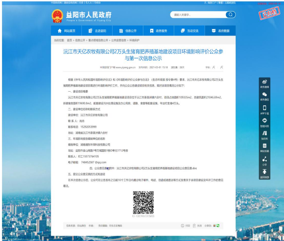
图 2-1 第一次公示网络截图