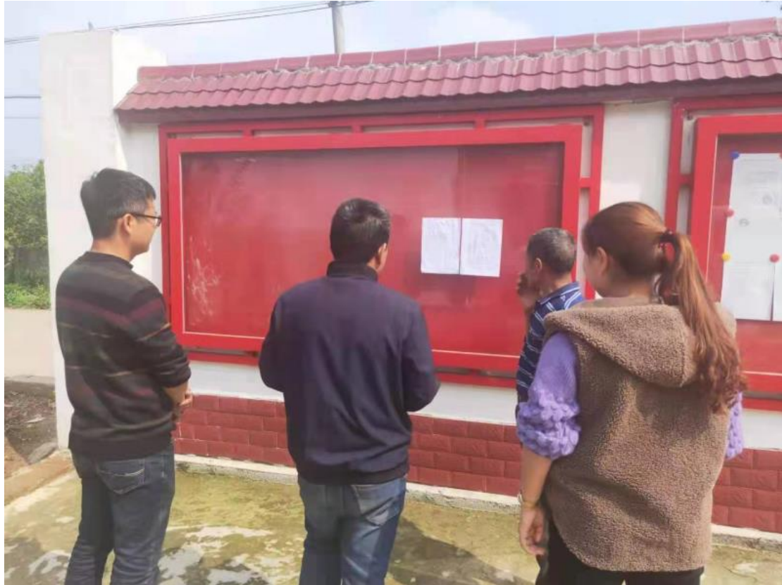
图 3-4 现场张贴公告

我公司于 2021 年 6 月 4 日在茶盘洲镇六合村村委张贴了本项目环境影响评价第二次公示的公告。具体情况见图 3-4。