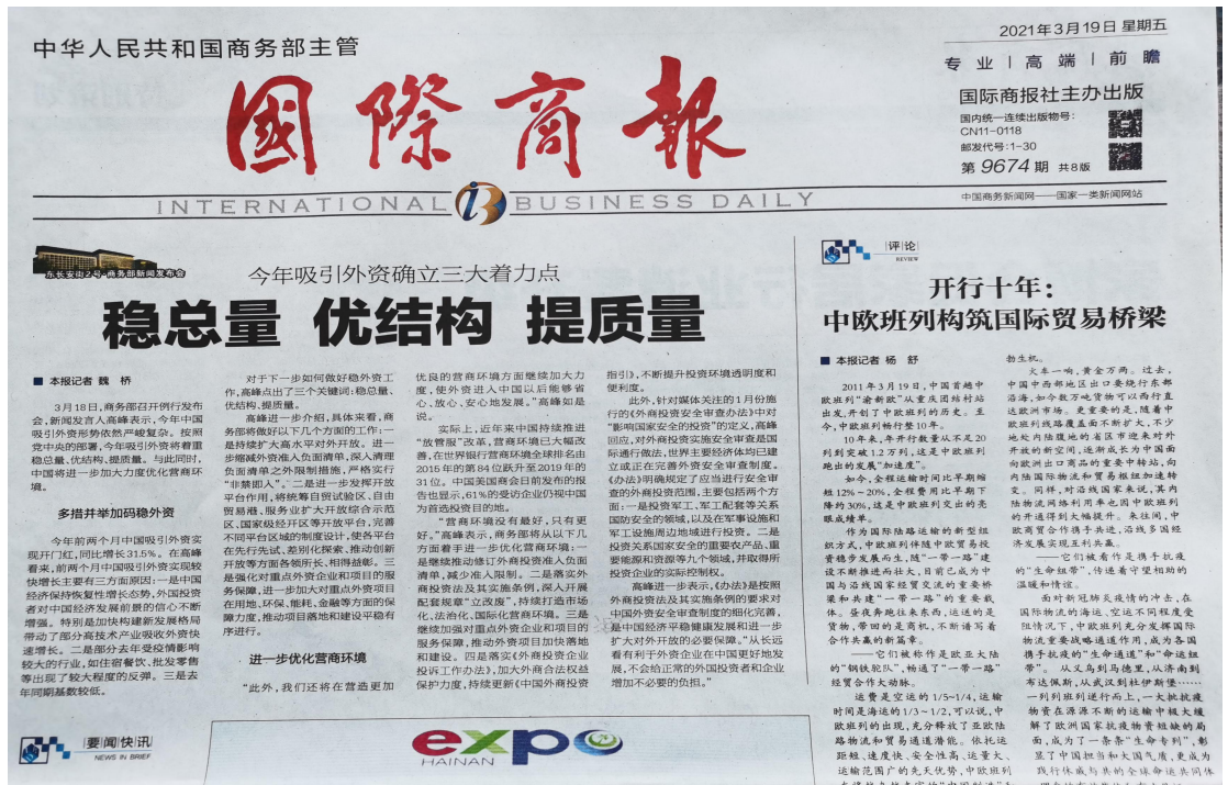
图 3-2 2021 年 3 月 19 日报纸公示

公众参与办法》“通过建设项目所在地公众易于接触的报纸公开，且在征求意见的10个工作日内公开信息不得少于2次”的要求。