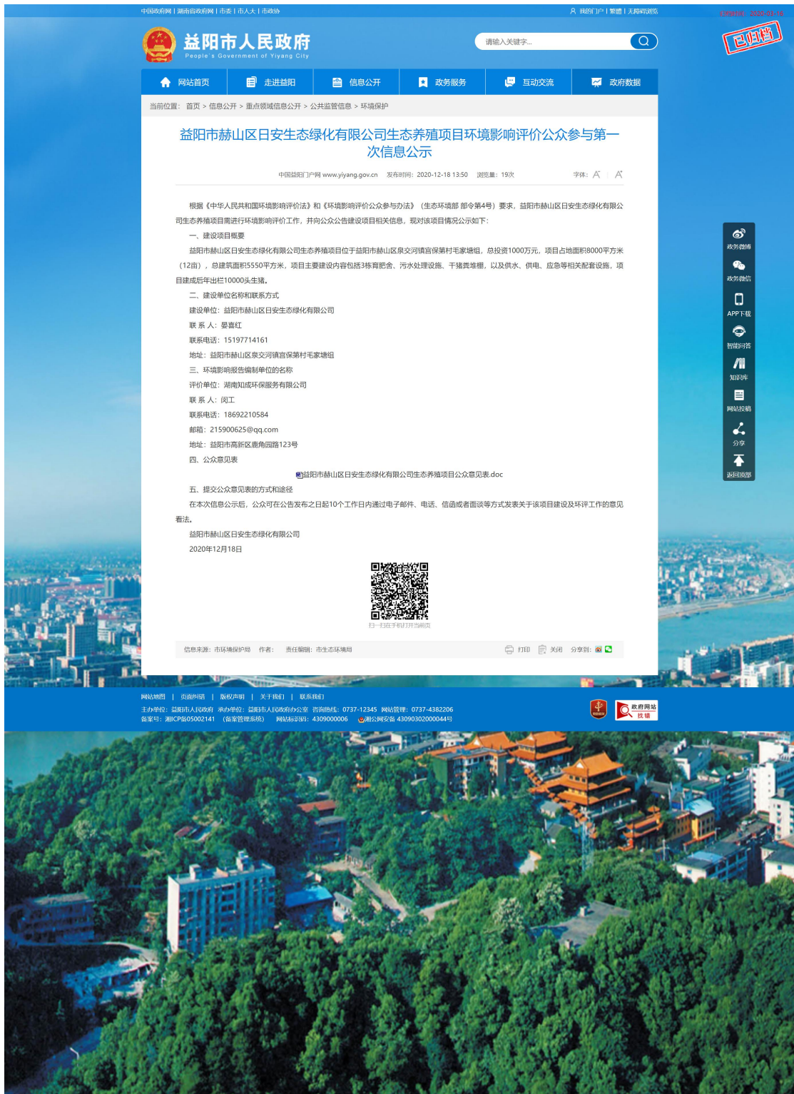
图 2-1 一次公示网络截图