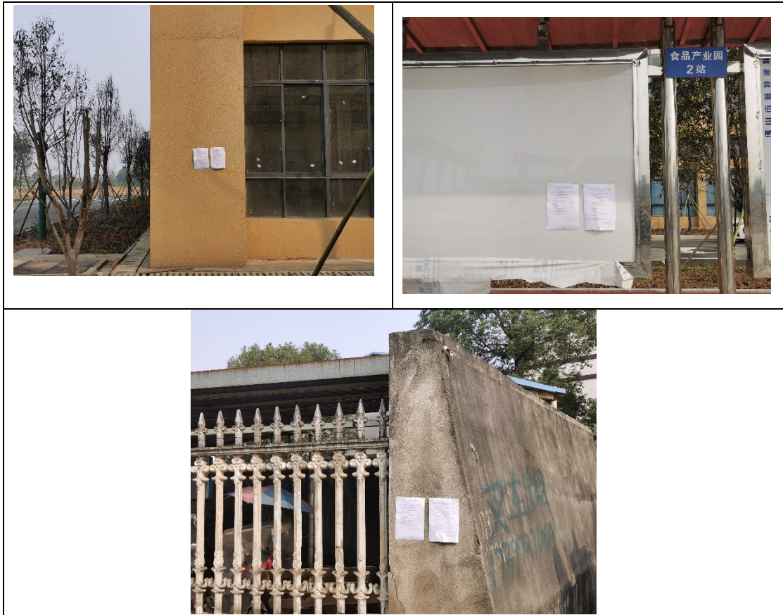
图 3.2-4 现场公示照片