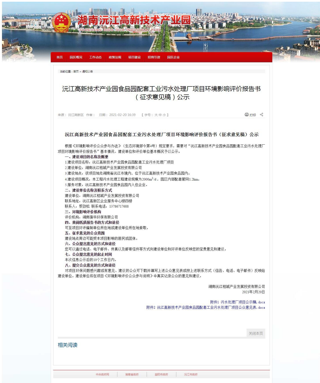
图 3.2-1 项目第二次网上公示