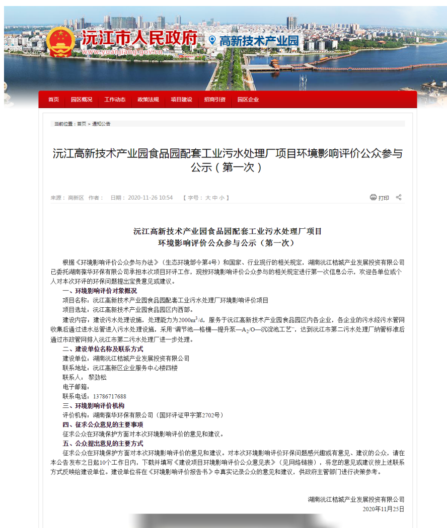
图 2.2-1 项目第一次网上公示

首次环境影响评价信息采用网络公示，公示网站为沅江市人民政府网站，本项目第一次环境影响评价信息公示选取的网络平台符合要求。2020 年 11 月 25 日，建设单位在沅江市人民政府高新技术产业园网站上进行了第一次公众参与公示（网址： http://www.yuanjiang.gov.cn/20406/content_1296700.html ），网上公示截图见图 2.2-1。