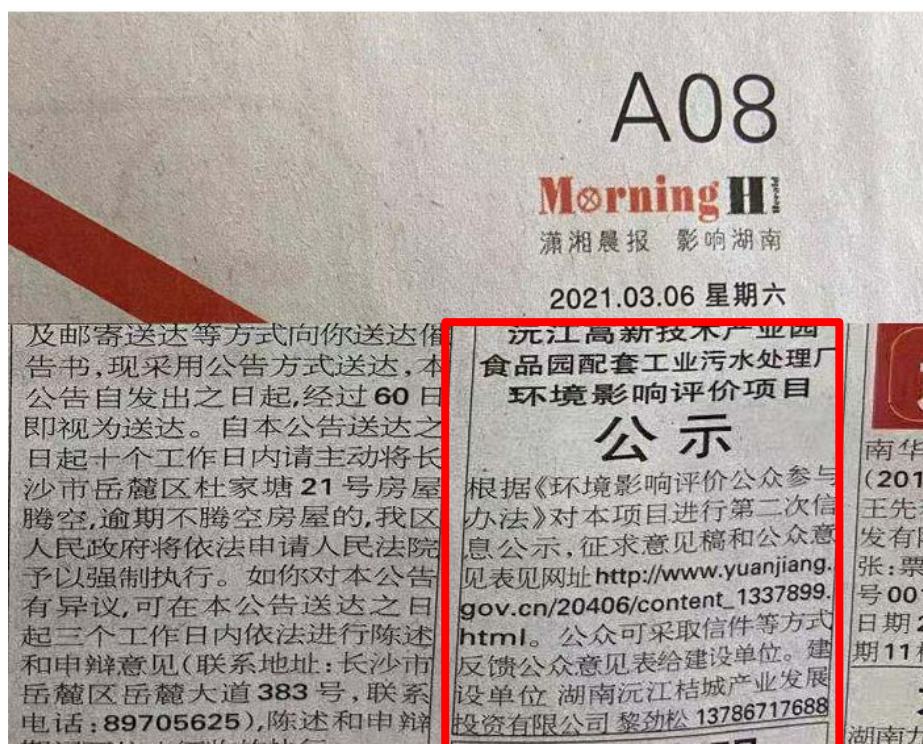
图 3.2-3 3月6日报纸信息公示