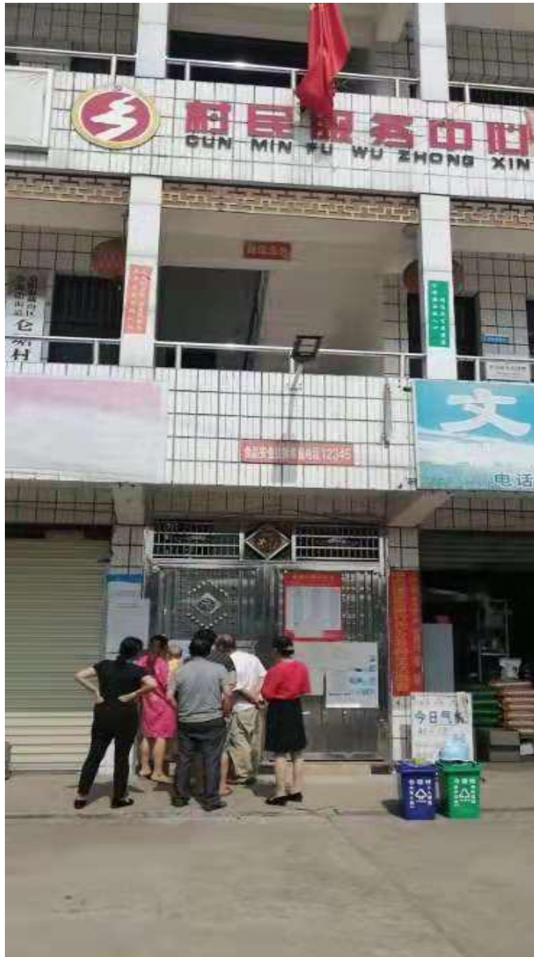
图 5 项目环评征求意见稿张贴公示照片