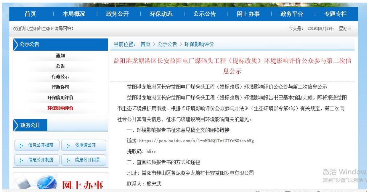
图2 项目第二次环评征求意见稿的公示截图