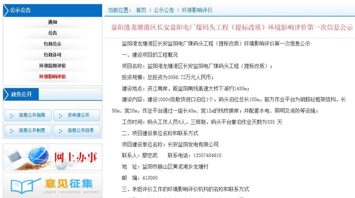
图 1 项目第一次环境影响评价信息公开公示截图