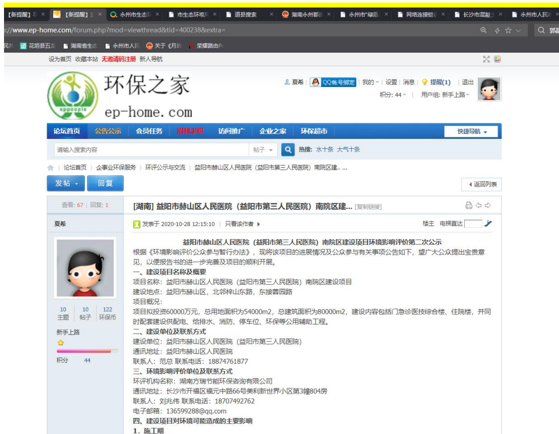
图 3.2-1 项目第二次网上公示截图