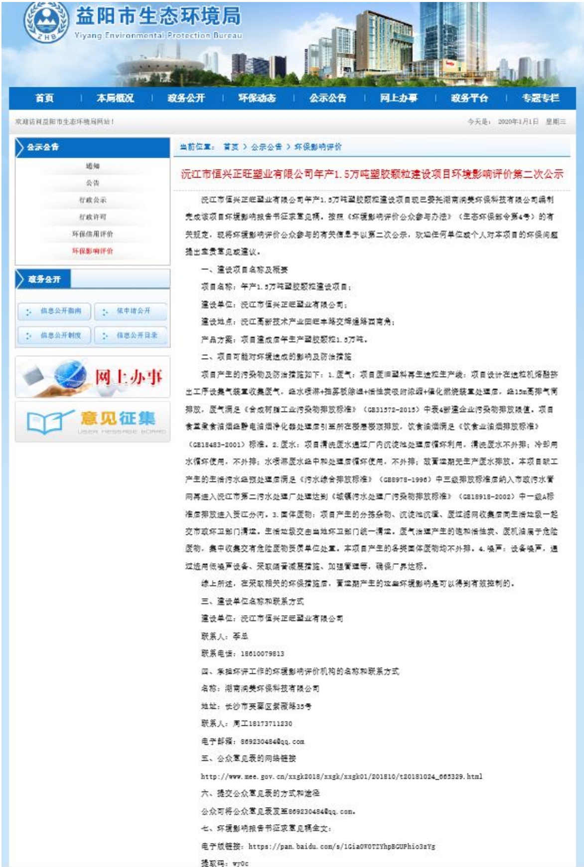
图4 征求意见稿网络公示截图(益阳市生态环境局网站)