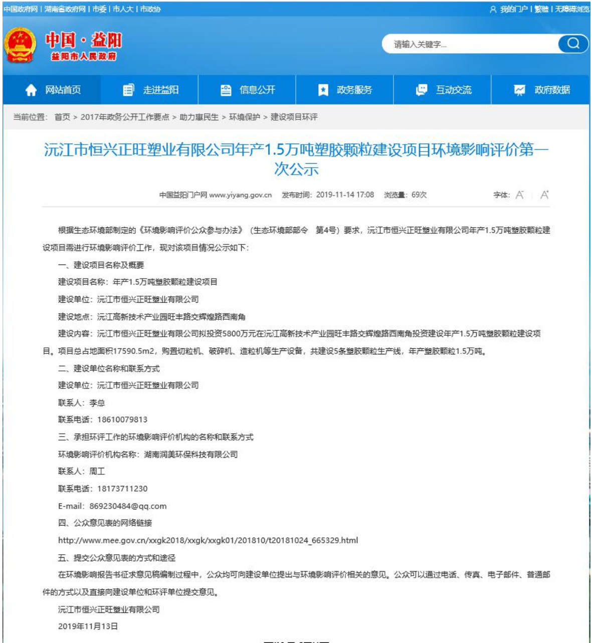
图1 首次环境影响评价信息公开网络公示截图(益阳市人民政府网站)