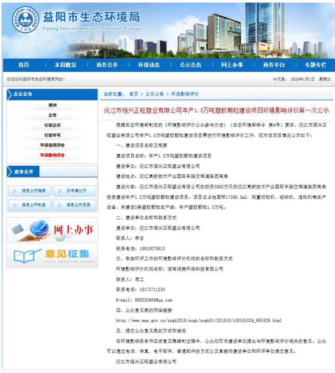
图2 首次环境影响评价信息公开网络公示截图（益阳市生态环境局网站）