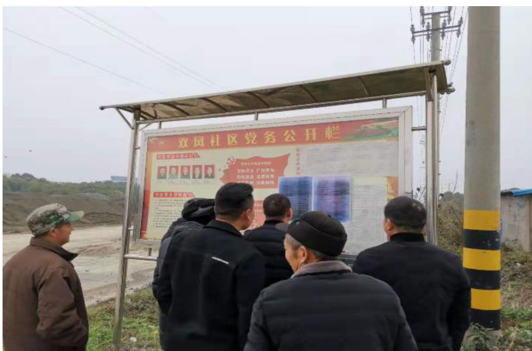
图 7 现场张贴照片