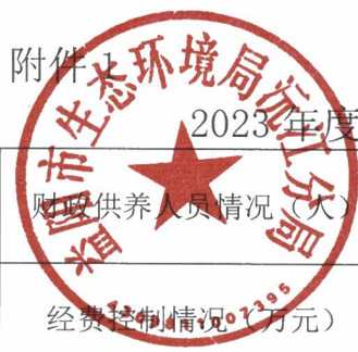
2023年度部门整体支出绩效评价基础数据表