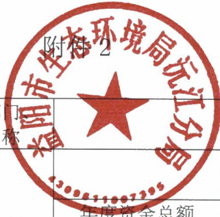
2023 年度部门整体支出绩效自评表