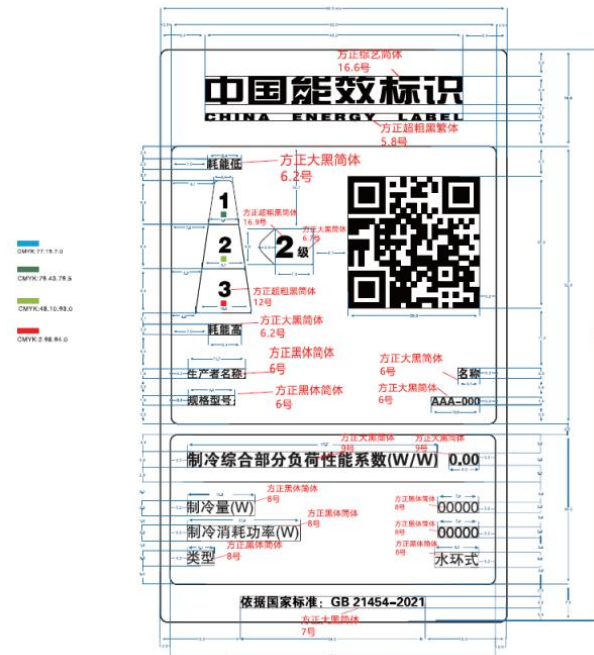
图 3-1 水冷式（水环式）多联机能源效率标识样式示例