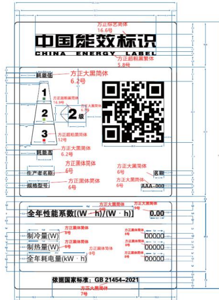
图 2 风冷式热泵型多联机能源效率标识样式示例