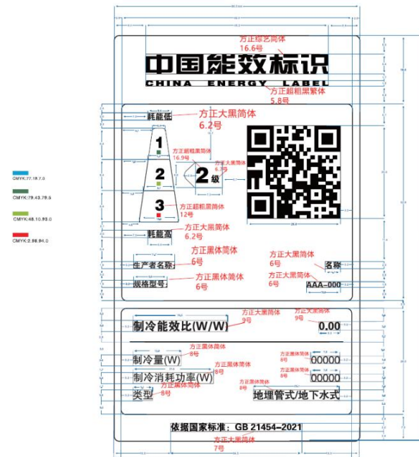
图 3-2 水冷式（地埋管式、地下水式）多联机能源效率标识样式示例