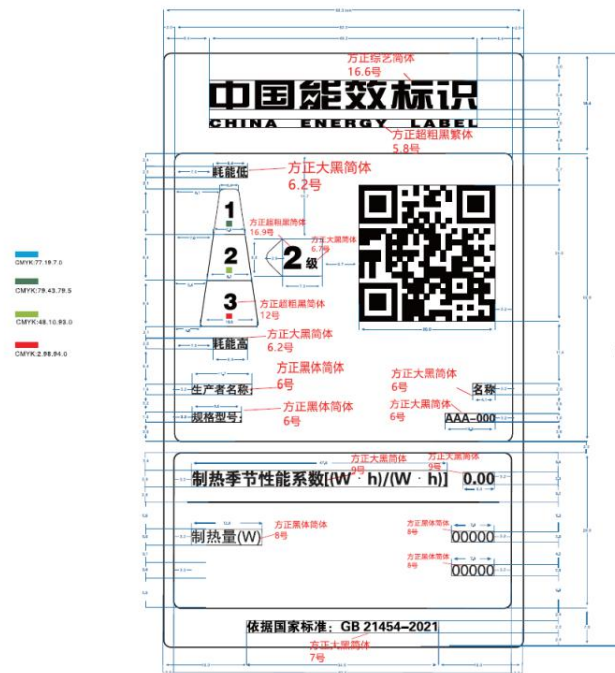
图 4 低温多联机能源效率标识样式示例